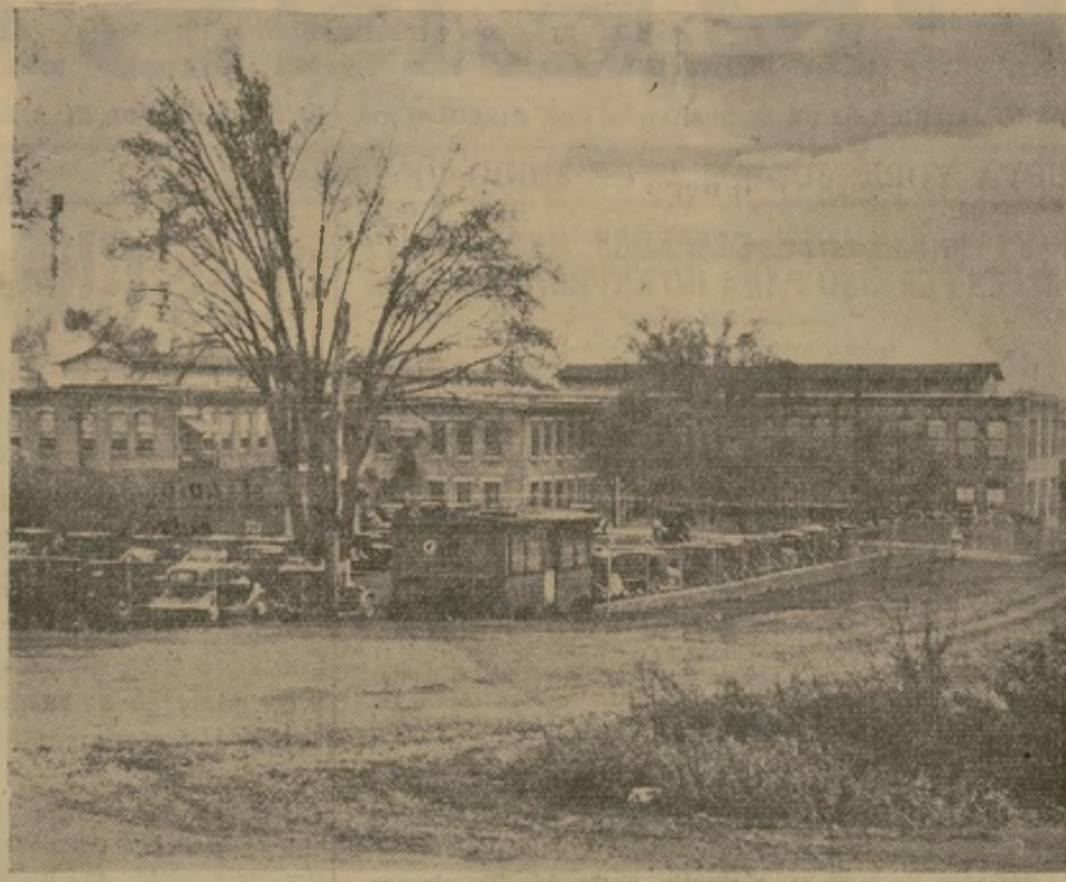
La fábrica de medias de Harriman, Tenn., que ha cerrado sus puertas, dejando en la calle a 653 obreros, en vista del acuerdo adoptado por sus directores de que "la acción del general Johnson y la NRA los han convencido de que su intención es arruinar a la casa." El aguila azul le fué retirada por el general Johnson en abril, por violación de la Ley de Resurgimiento.