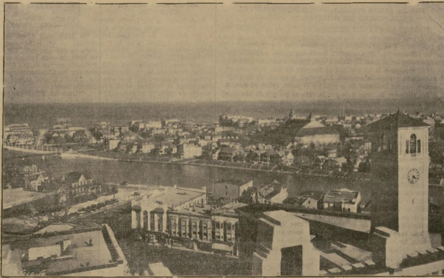
Vista parcial de Asbury Park, New Jersey, lugar concurridísimo por excursionistas y veraneantes, por su bellísima playa y sitios para diversiones, muy popularizados entre las colonias de habla española.