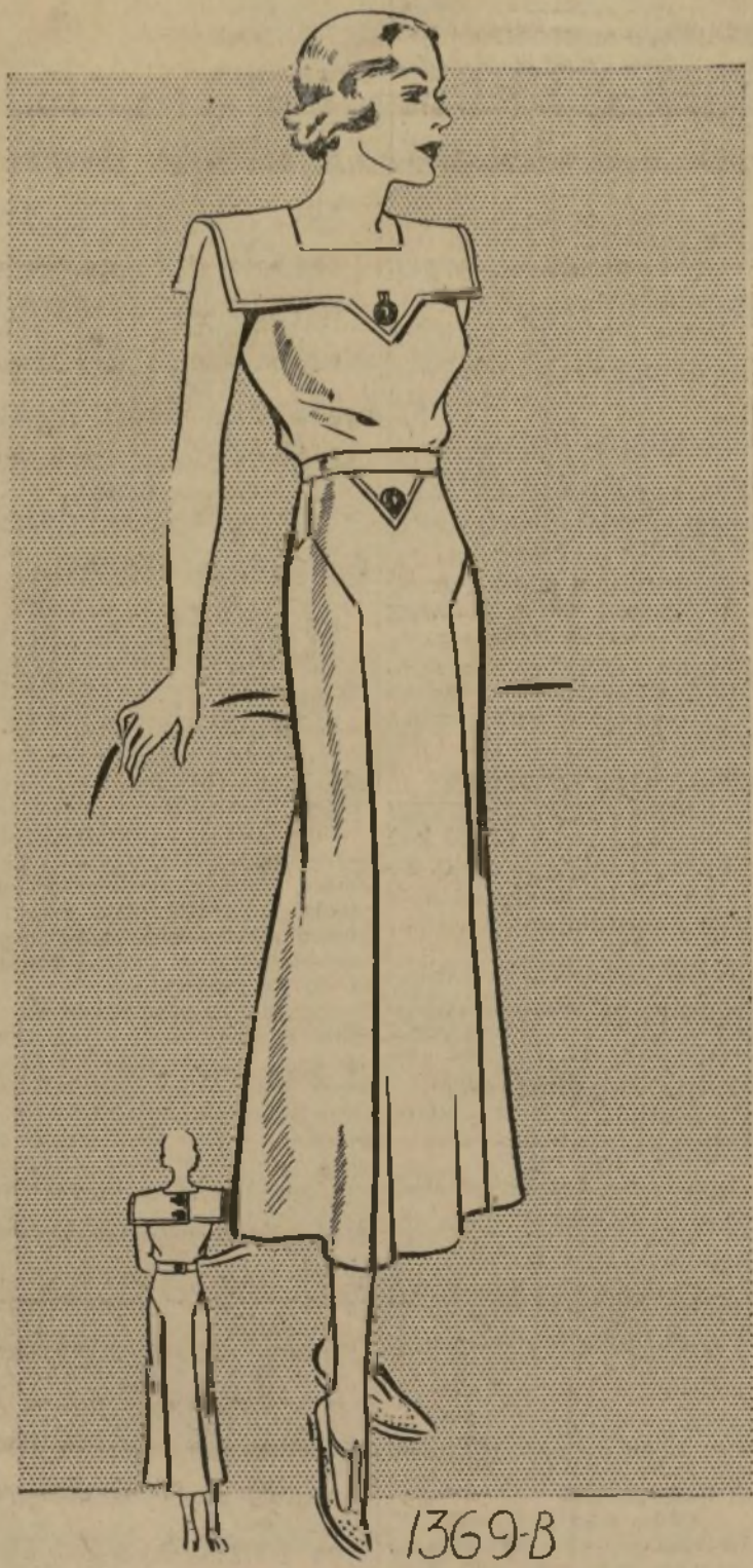
1369-B VESTIDO DE CIUDAD O CAMPO