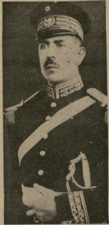
General Lázaro Cárdenas

Mañana se elegirá el sucesor del presidente Abelardo Rodríguez—Se da por seguro el triunfo del general Lázaro Cárdenas, candidato del Partido Nacional Revolucionario.