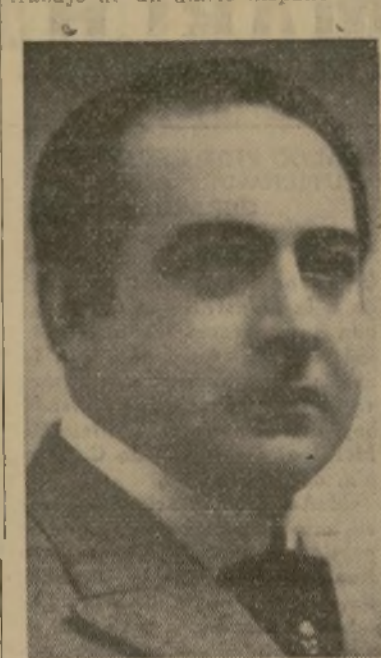
El tenor D. Pedro Lafuente

Una irrupción del espíritu vasco — fuerte, alegre, optimista, cordial y sincero — es la mejor inversión posible para levantar el ánimo, en un torrido día estival, hacia el término de la jornada de trabajo de un diario hispano neoyorquino.