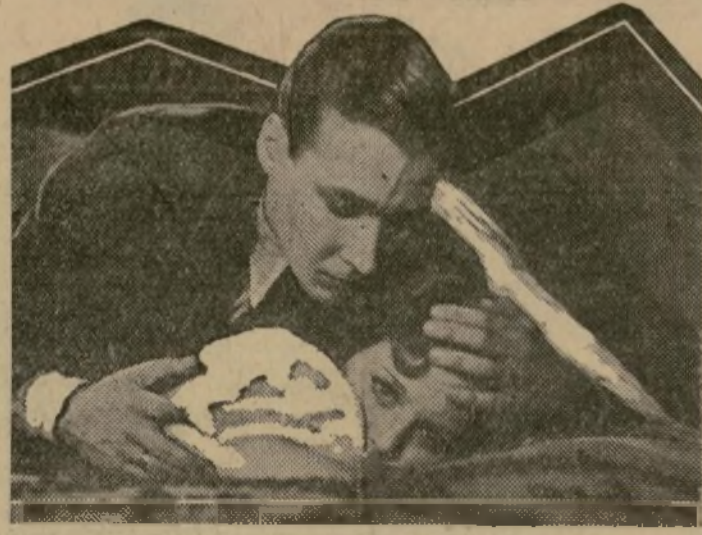
Douglas Montgomery y Margaret Sullivan en una escena de "Little Man, What Now?", película que empieza hoy en los teatros "Hamilton" y "Regent."