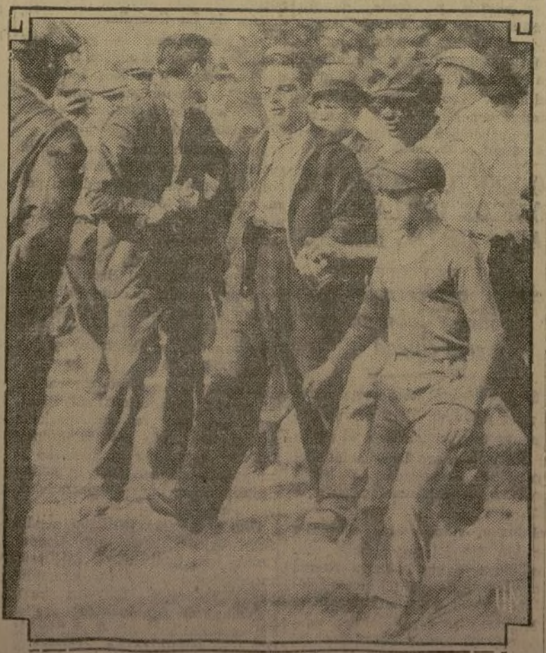
Quizá tengan resentimientos con los patronos, pero estos huelguistas mineros de las cercanías de Brownsville, Pa., no estaban de humor para oír improperios comunistas. Aquí se les ve desechando a un comunista que trató de dirigirlas la palabra durante un mitin en el que los mineros decidieron continuar sus "vacaciones" hasta que reconociera su sindicato.