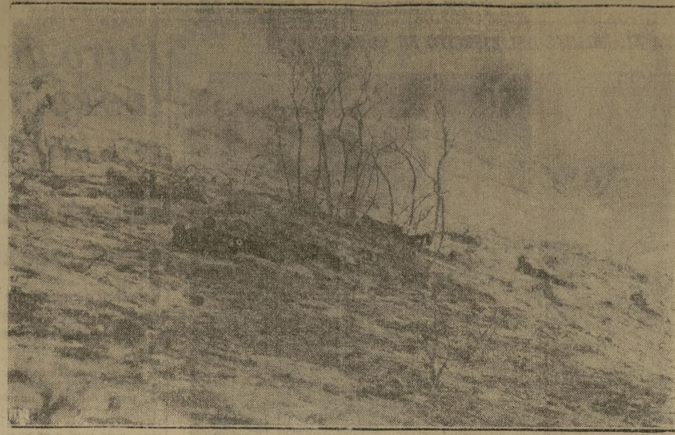
Esta fotografía tomada después de conseguirse dominar las llamas, muestra la parte de Griffith Park de Los Angeles en donde yacen algunas de las víctimas que perecieron en el fuego. Peones camineros que fueron alcanzados por las