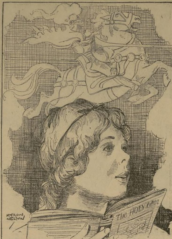
Leí las historias de los nobles caballeros... Llegué a tener mucho respeto por el honor... por las virtudes aristocráticas...

Detuvo de pronto con un gesto irreprimible de sobresalto. Porque una mujer fuera joven y linda, hasta infantil, no había razón alguna para que no pudiera ser capaz