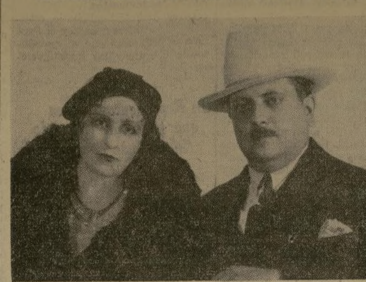
El Gobernador del Estado de Puebla, general J. Mijares Palencia, y su distinguida esposa doña Aurora del Valle de Mijares, al presente en esta ciudad. El General Mijares Palencia viene en viaje de estudio y de placer y ha visitado diversas ciudades.