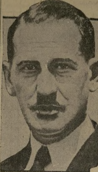
Dr. Ramón Grau San Martín

militares que estén también acusados de delitos en apoyo de la dictadura machadista, serán juzgados aisladamente de cada crimen.