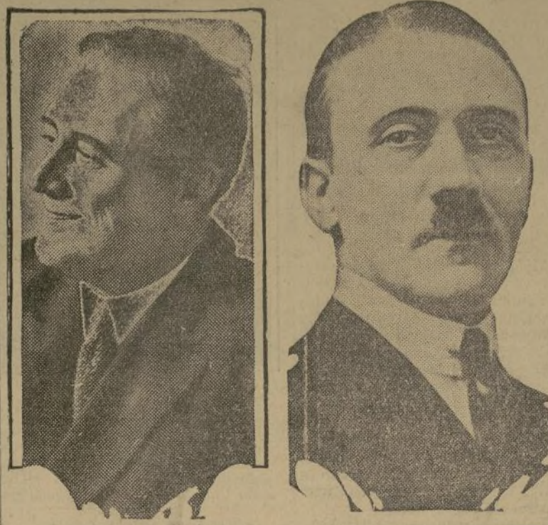
FRANKLIN D. ROOSEVELT