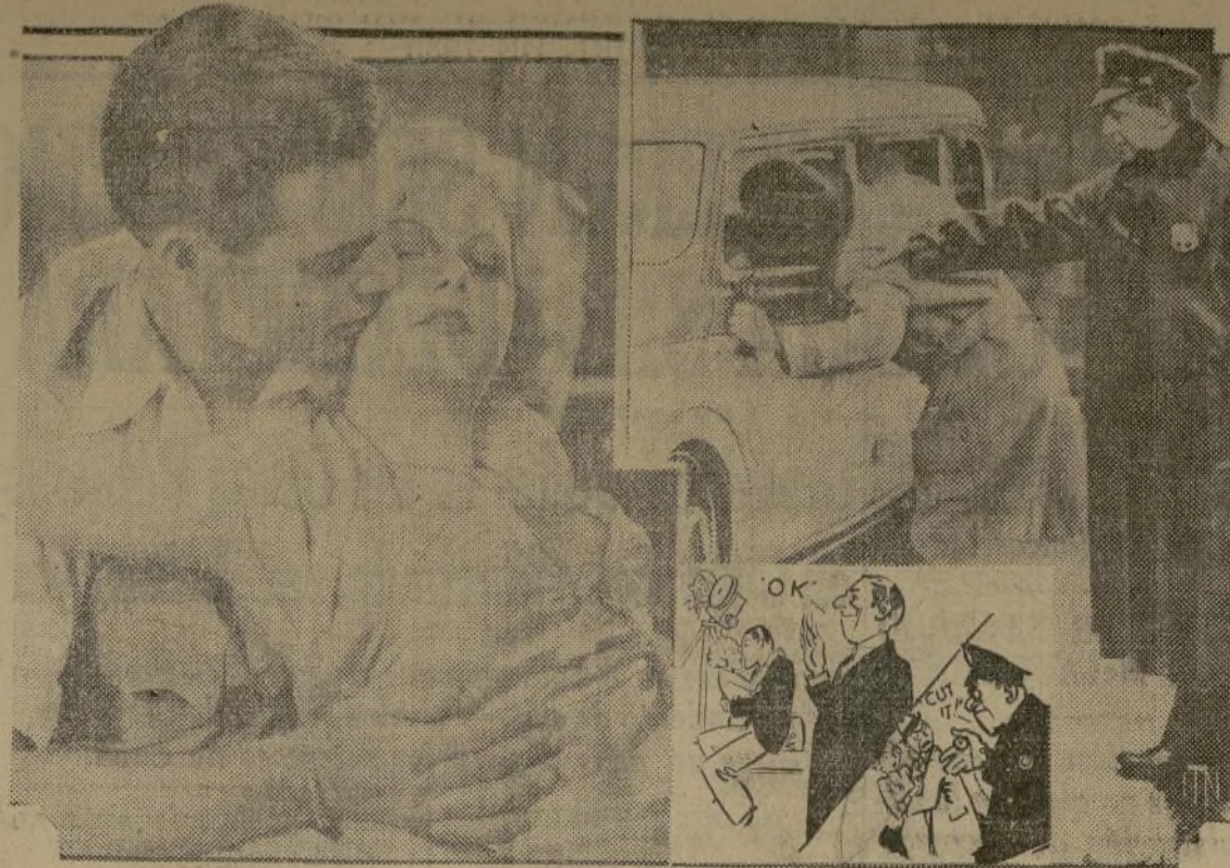
Los pesos largos de despedida, por la mañana, están prohibidos en Bronxville, porque dice la policía que interrumpen el tráfico. En cambio en Hollywood, los señores no han decretado aún la duración que deben tener esas muestras de afecto y en el grabado de la izquierda, Clark Gable y Jean Harlow demuestran la técnica del asunto.