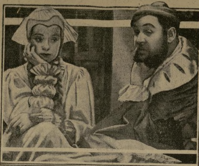
Charles Laughton y Elsa Lanchester en "The Private Life of Henry VIII" que de sábado a martes se ofrece en los teatros Hamilton y Regent.