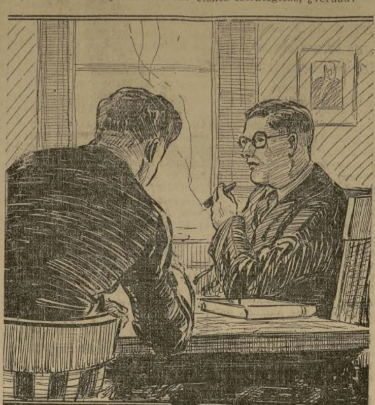
—Y, sin embargo, dijo el doctor Cavanaugh— eso difícilmente explica por qué Orme hubiera de salir de su mundo para matar a una rica y casi célebre veterana del teatro...