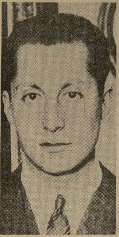
D. José Antonio Primo de Rivera

MADRID, octubre 29. (A). — El primogénito del difunto general don Miguel Primo de Rivera, Marqués de Estella, el dictador de España a cuyo gobierno de siete