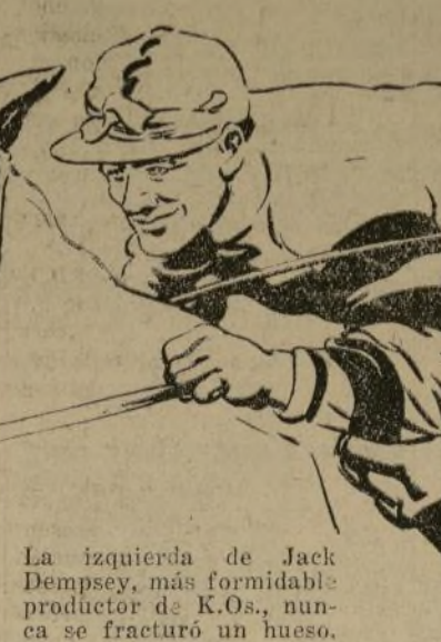
La izquierda de Jack Dempsey, más formidable productor de K.O.s, nunca se fracturó un hueso.

Hacia mediados de septiembre de 1933, las poderosas manos del "jockey" Jackie Westropes habían conducido a la victoria a 213 caballos! (Nuevo "record" mundial.)