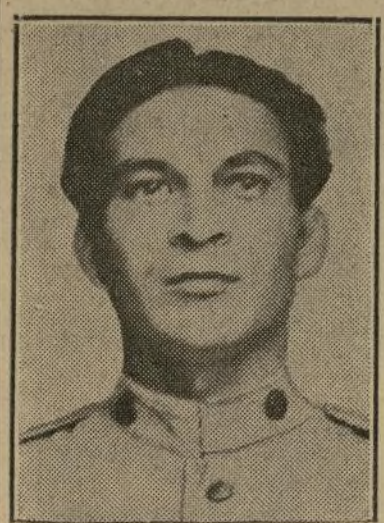
Coronel Fulgencio Batista

El coronel continuó mencionan- do que su nombre había sido pro- puesto por los sectores revolu- cionarios para la presidencia pro- visional y afirmando que se le ha- bía, de hecho, ofrecido la presi- dencia, agregó: "Rehusé por mu- chas consideraciones, entre ellas principalmente estando el convenio hecho por los naciona- listas a la cuestión de carteras en