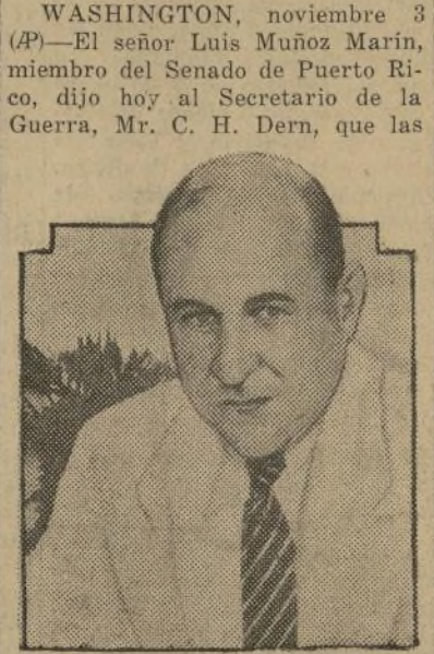
Gobernador Robert H. Gore

Muñoz Marín se entrevi- stará en breve con el Pde. Roosevelt.