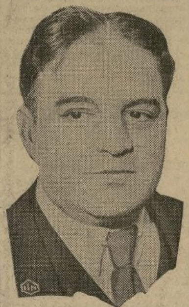
Fiorello La Guardia

Tres personalidades diametralmente opuestas, más que distintas, presentan los tres principales candidatos en la lucha municipal de hoy. Los tres, sin embargo,