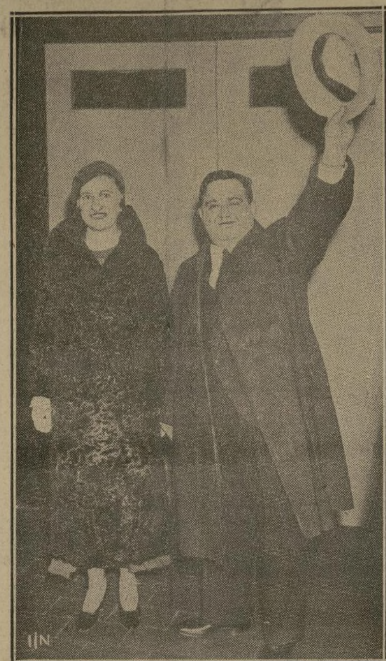
El Alcalde electo, Comandante Fiorello H. La Guardia, acompañado de su esposa, saluda a una multitud de partidarios después de su resonante triunfo.