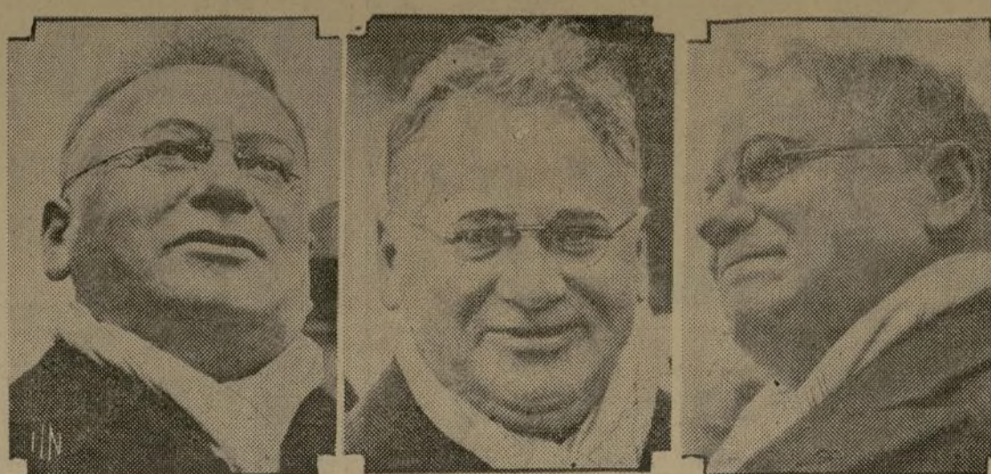
A su llegada a los Estados Unidos el objetivo sorprendió estas del comisario ruso, Maxim Litvinov, que se encuentra ahora en el presidente Roosevelt acerca del reconocimiento de su país por los EE. UU.