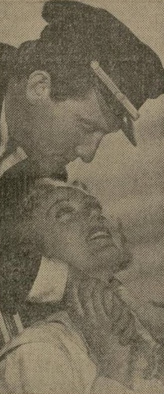
Spencer Tracy y Fay Wray tienen las características de romances y aventuras en "Shanghai Madness" que se ofrece en el Mt. Morris de miércoles a viernes.

De miércoles a viernes, el Teatro Mt. Morris ofrecerá la apariencia de una calle, bruja e impenetrable de China. Shanghai no será sino una leve sombra de la realidad, cuando en la pantalla del