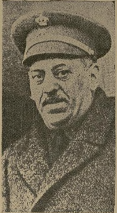
El ex general D. José Sanjurjo

MADRID, noviembre 16.—La aceptación por el ex general Sanjurjo, desde su celda del Penal del Dueso, en Santaña, en el cual cumple su condena de prisión perpetua en la cual se conmutó