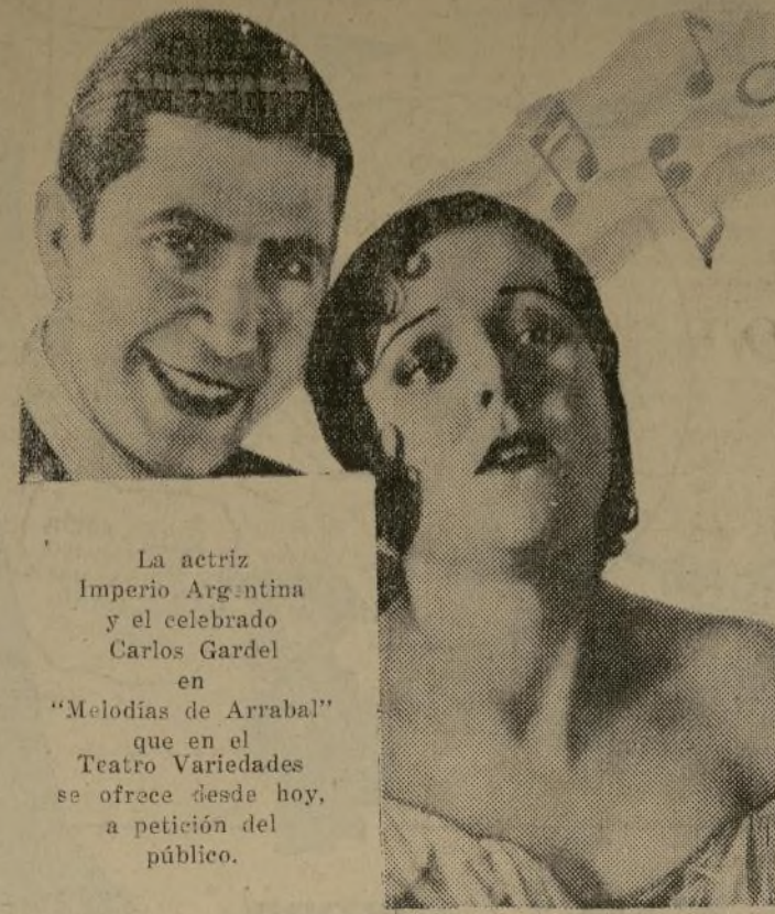
La actriz Imperio Argentina y el celebrado Carlos Gardel en "Melodías de Arrabal" que en el Teatro Variedades se ofrece desde hoy, a petición del público.