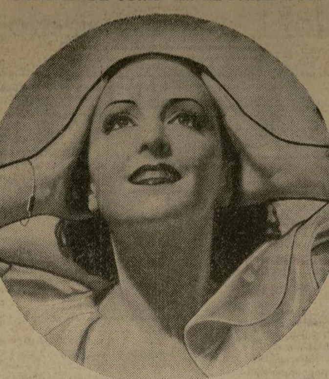
Dorothy Wieck, en su debut americano, según aparece en una escena de "Cradle Song" ahora en el Paramount.