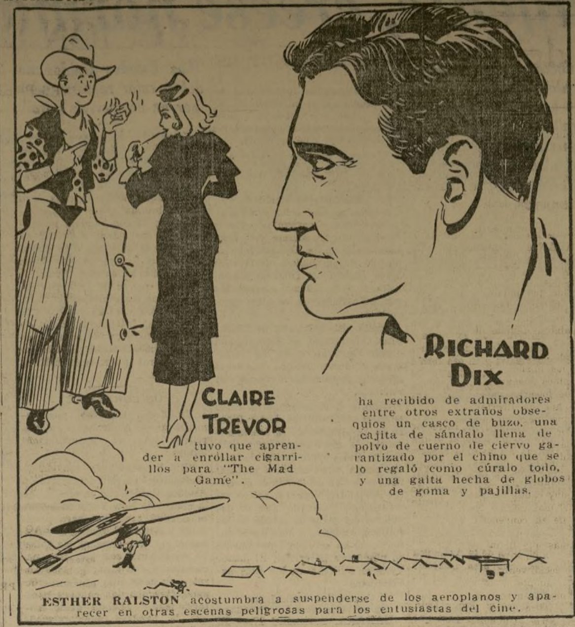
ESTHER RALSTON acostumbraba a suspenderse de los aeroplanos y aparecer en otras escenas peligrosas para los entusiastas del cine.