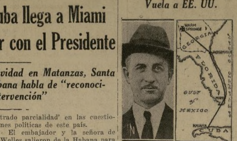
Vuela a EE. UU.

En el muelle de la Pan American Airways, Mr. Welles limitó a decir simplemente a los corresponsales periodísticos: "les veré de nuevo pronto." No había representantes del gobierno cubano en el muelle cuando partió el embajador.