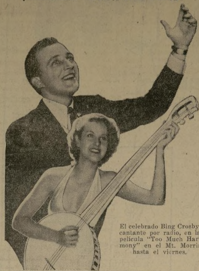
El celebrado Bing Crosby, cantante por radio, en la película "Too Many Harmons" en el Mt. Morris hasta el viernes.