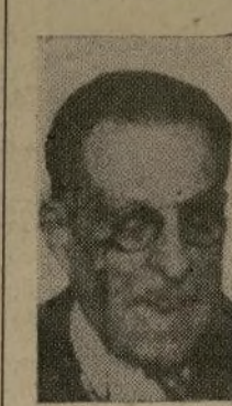
D. M. Márquez Sterling

El embajador de Cuba en los Estados Unidos, don Manuel Márquez Sterling, una de las más eminentes personalidades de su patria y, sin duda, uno de los prestigios cubanos más respetados en este país, dirigió anoche a "LA PRENSA" por medio de un mensaje especial, rectificando en la forma más categórica y autorizada, las declaraciones hechas en Panamá el día antes por el señor Herminio Portell Vilá, en relación con los relaciones políticas actuales entre los Estados Unidos y Cuba.