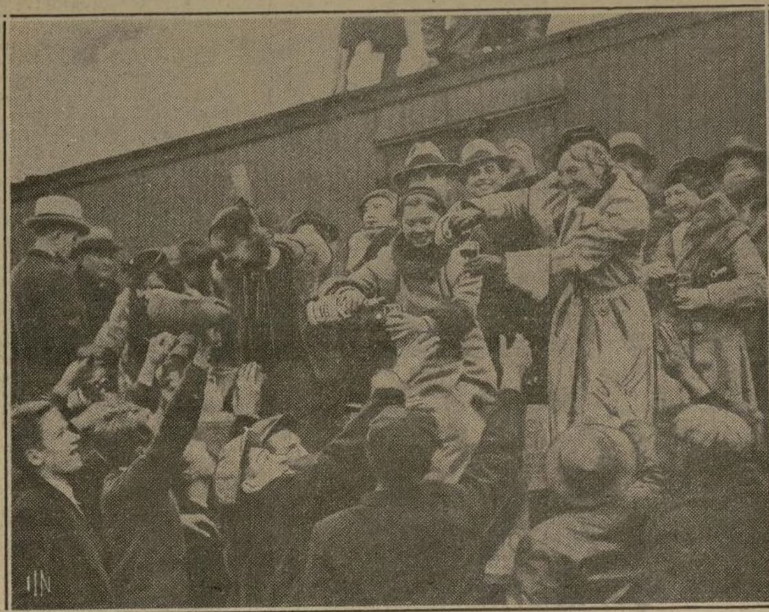
Varias preciosidades repartiendo muestras cuando llegó a Jersey City el tren especial vinícola, desde Asti, California, con 175,000 galones de jugo de uva para hacer frente a la celebración de la derogación en Nueva York. Nunca se había recibido un tren de mercancías con tanta alegría.