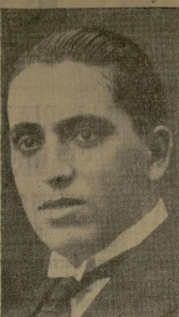
Sr. José Calvo Sotelo