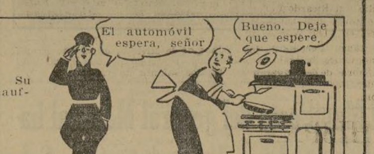
El automóvil espera, señor

prepara su desayuno. Su único sirviente es el chauffeur.