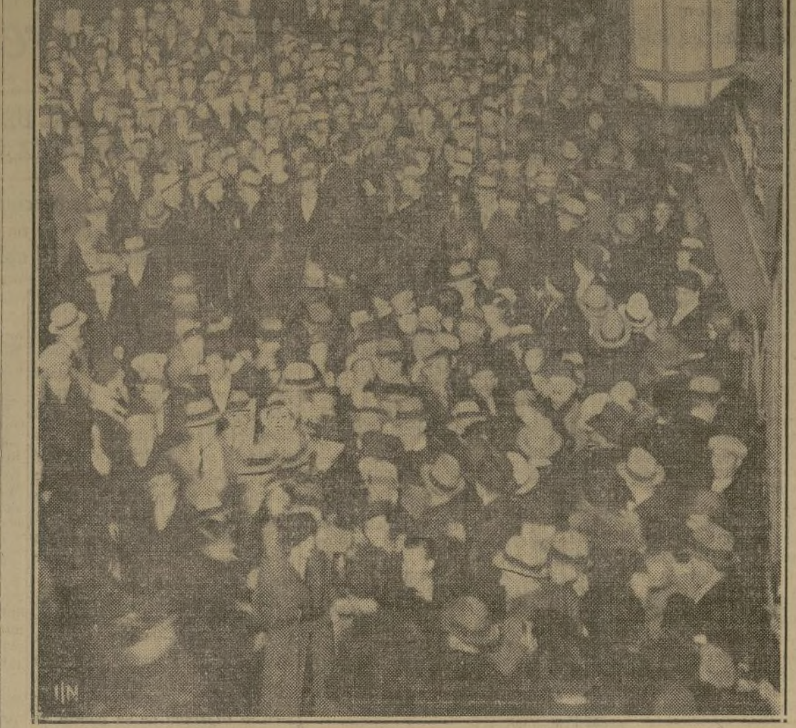
Los neoyorquinos invadieron Broadway para dar la bienvenida al dios Bacardi. En el grabado se ve a la guardia municipal montada, entrando en las aceras para evitar el estancamiento del tráfico.

La primera semana de diciembre de 1933, dijo Ernest, pasará a la historia por dos derogaciones: la de la prohibición y la de los remilgos en la literatura. Al presente podemos ingerir libremente el contenido de las botellas y de los libros rectos.