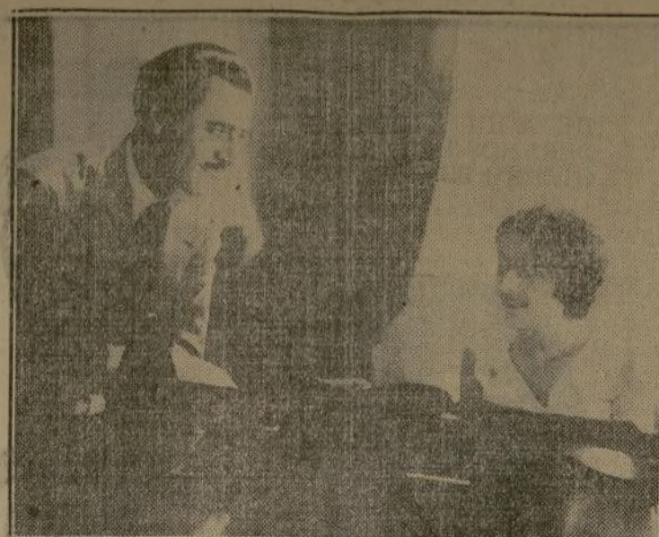
Intrigante momento de incertidumbre durante una escena de "Su Noche de Bodas" por Imperio Argentina que ahora se exhibe en el Teatro Variedades de Manhattan.