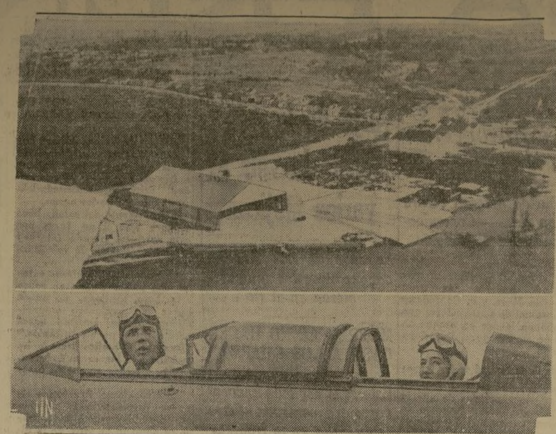
El coronel Charles A. Lindbergh y su esposa recibieron la bienvenida en el precioso aeropuerto de Natal, Brasil, al terminar el cruce sobre el Atlántico meridional, desde Bathurst, Africa. Mrs. Lindbergh recibió muchos aplausos por la forma magistral en que envió los informes radio-gráficos del progreso que iba haciendo el aparato.