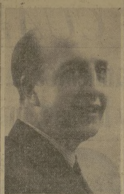
DON LUIS DE OTEYZA, Ministro de España en Venezuela

En la política de práctico acercamiento de España a sus hermanas de América, que intensifica cada día más la República, el señor Oteyza aparece ya como el más entusiasta y convencido colaborador en su misión a Venezuela.