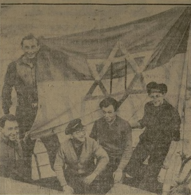
Palestina entra a formar parte entre las "naciones" que tienen marina mercante, al atracar a un muelle de Londres el vapor "Emanuel" izando la bandera de aquel país. En el grabado se ven a varios tripulantes junto a la bandera.