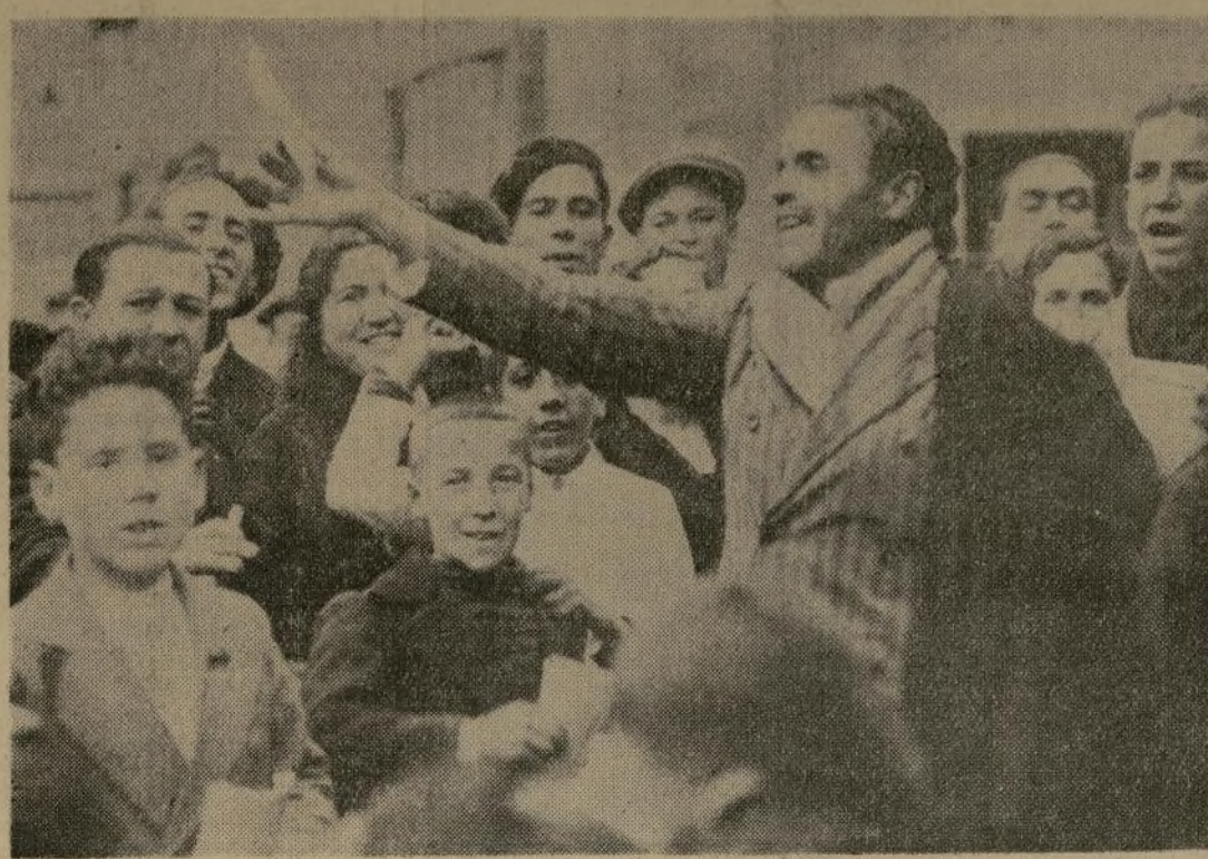
Un orador callejero español arengando a la multitud en Madrid durante el periodo inmediatamente anterior al golpe sindicalista que produjo tan grande derramamiento de sangre en toda la península.