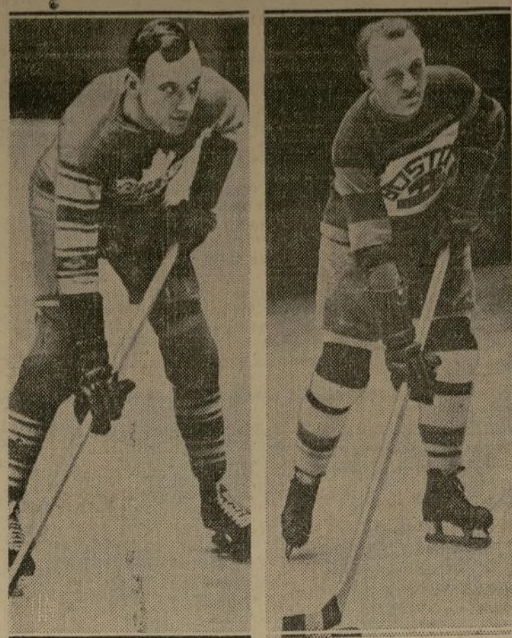
Irving Bailey Herido durante un partido de "hockey" con los Boston Bruins, Irving (Ace) Bailey, estrella de los Toronto Maple Leafs, seguía ayer en gravísimo estado en un hospital de Boston con el cráneo fracturado. Bailey resultó herido al ser acometido por la espalda por Eddie Shore, de los Bruins. Esto constituye un "foul".