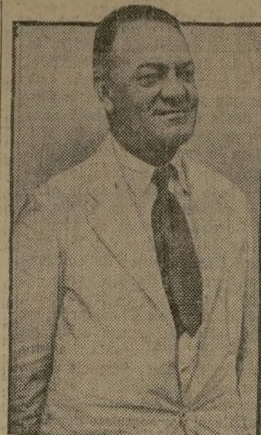
General Hugh Johnson

(Servicio Especial de LA PRENSA) WASHINGTON, diciembre 15.—"La NRA se familiarizará con el problema industrial de Puerto Rico a través de la Junta Regional", ha dicho el General Hugh Johnson, administrador general de esta entidad, quien hablando sobre el problema que con relación a su organización se confronta Puerto Rico, ha dicho: