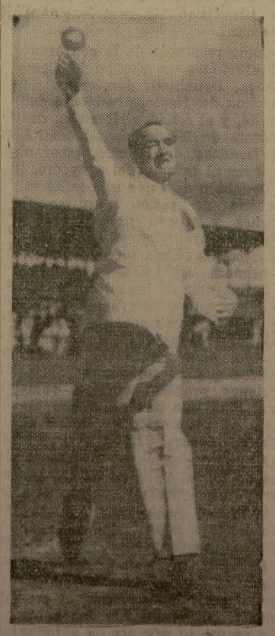
El gobernador general de Filipinas, Mr. Frank Murphy, tira la pelota con que se comienza el primer juego de la estación en Manila.