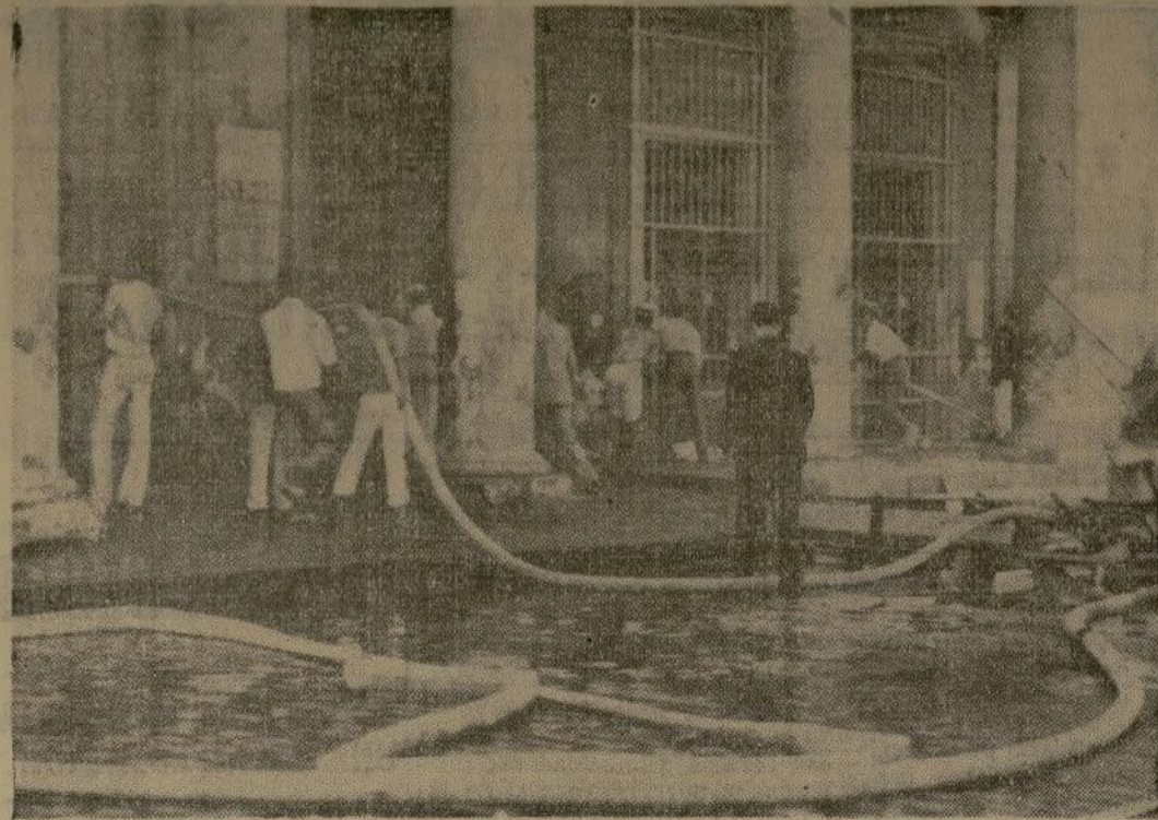
Oficinas del diario "El País," de la Habana, después de que los revoltosos le prendieron fuego como protesta por la oposición del periódico a la ley que obliga a los patronos a emplear un cincuenta por ciento de naturales del país.