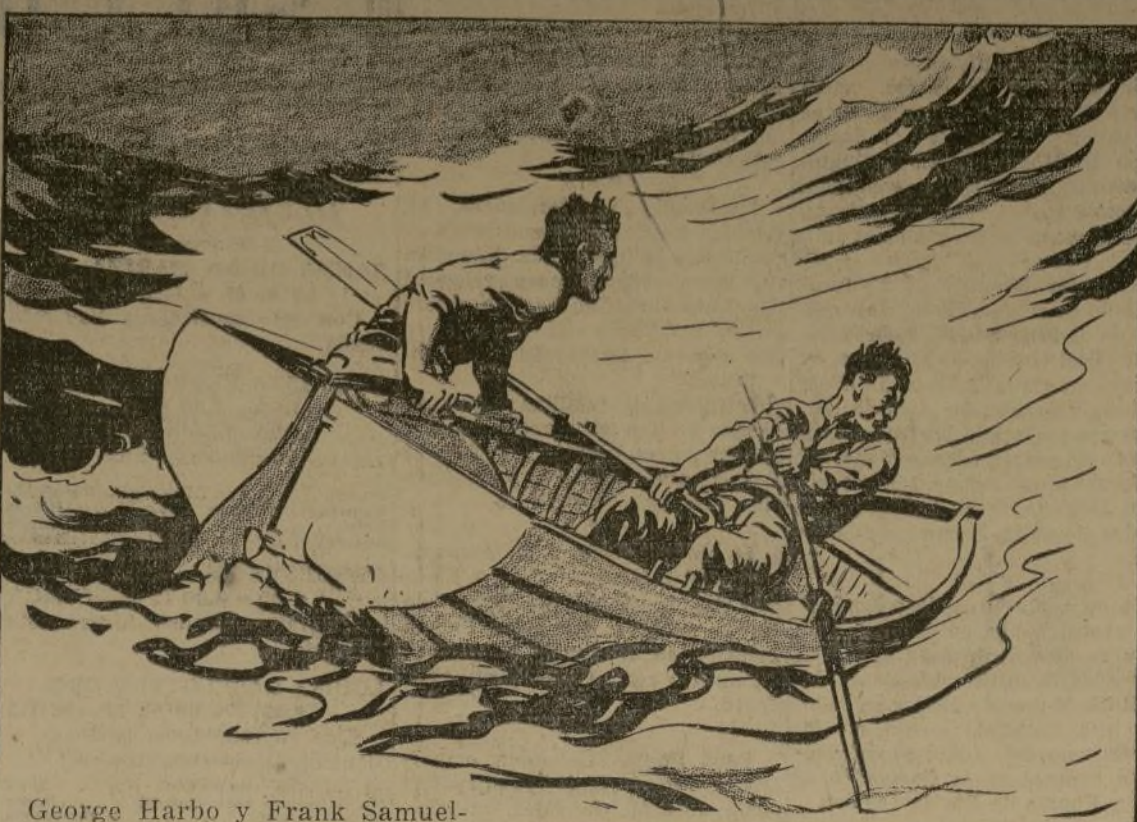
George Harbo y Frank Samuelson remaron 3,000 millas a través del Atlántico en 54 días. (Verano de 1896)