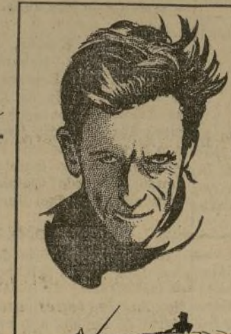
Alain Gerbault le dio la vuelta al mundo en un balandro de 30 pies de largo.