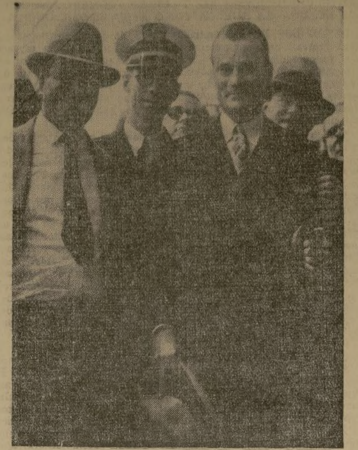
A su llegada a la Habana, Jefferson Caffery, representante especial del presidente Roosevelt, es objeto de calurosa bienvenida.