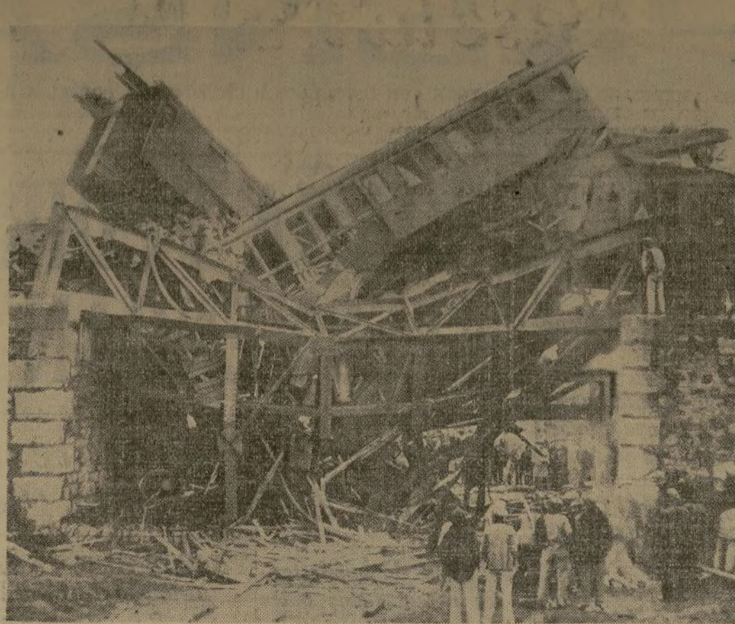
Estado en que quedaron algunos de los coches del expreso de la línea Sevilla-Barcelona, que descarriló a causa de un atentado terrorista y en cuya catástrofe murieron treinta viajeros, quedando heridos otros muchos.