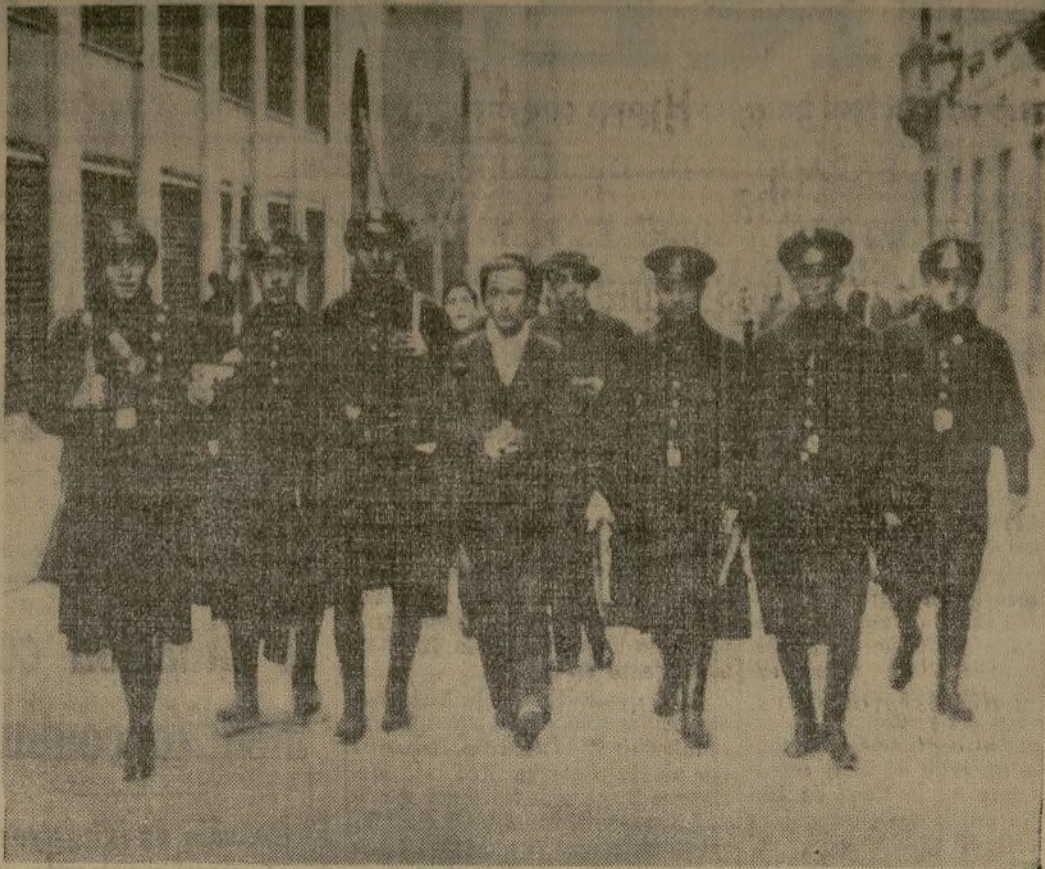
Grupo de guardias de asalto, conduciendo a un preso detenido en una de las luchas que se suscitaron en plena calle cuando los anarquistas comenzaron el movimiento subversivo.