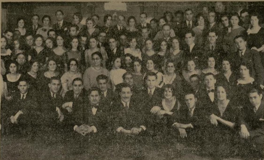
Con lucida animación se verificó el primer acto social de esta nueva agrupación hispana, en el Franklin Casino, asistiendo a la velada un amplio círculo de miembros de la colonia boricana, que fueron debidamente atendidos por los directivos de la sociedad. Los concurrentes mostraron su complacencia al darse por terminado el baile.