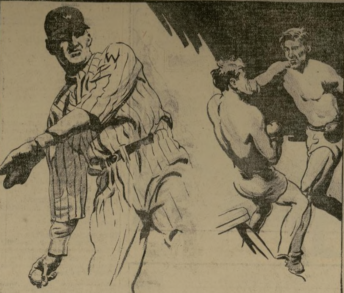
Walter Johnson lanzó durante la temporada de 1919 (290 "innings") sin conceder un solo "home-run."