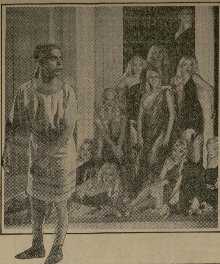
Eddie Cantor y las chicas Goldwyn en "Roman Scandals" que ahora se exhibe en el Rivoli Theatre.