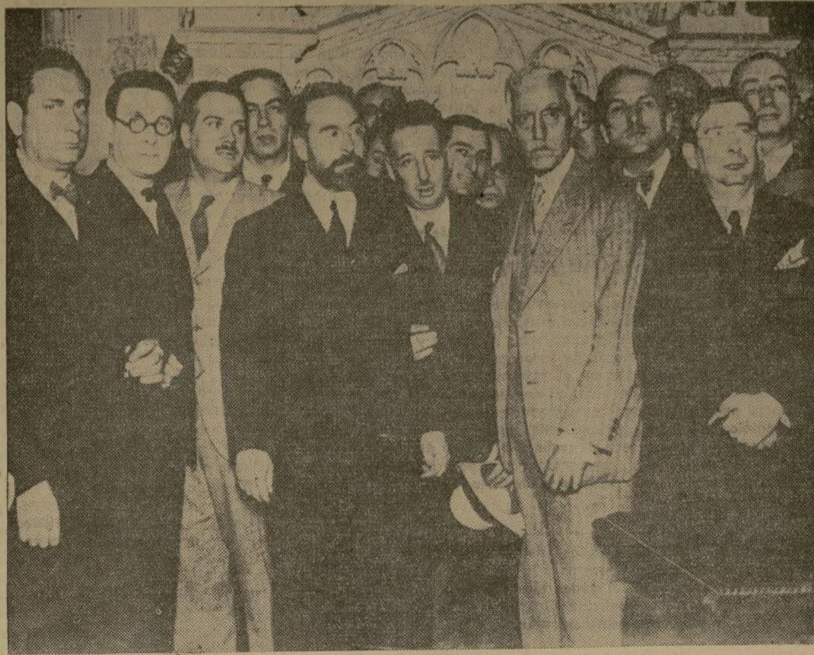
El señor Maciá, que falleció ayer, rodeado de sus lugartenientes de la Esquerra y de algunos ministros de la República.