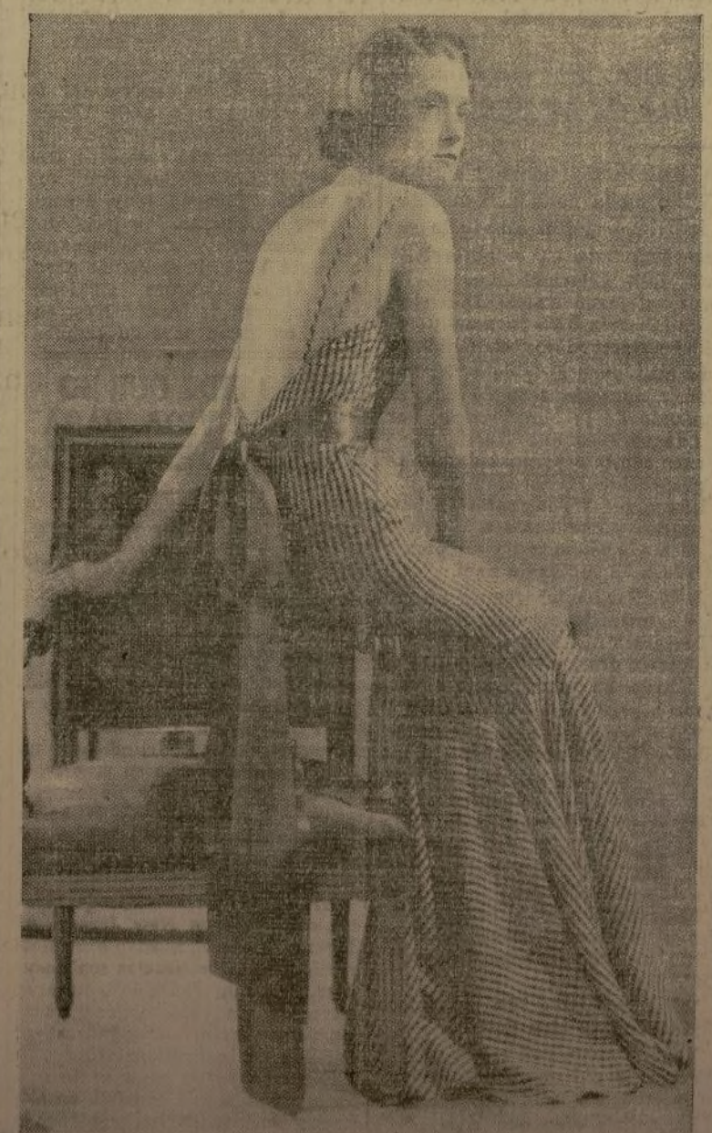
Este vestido es de seda a cuadros blancos y verdes, tiene un ancho volante y está adornado con una banda de seda color verde esmeralda. Se usa como traje de noche.