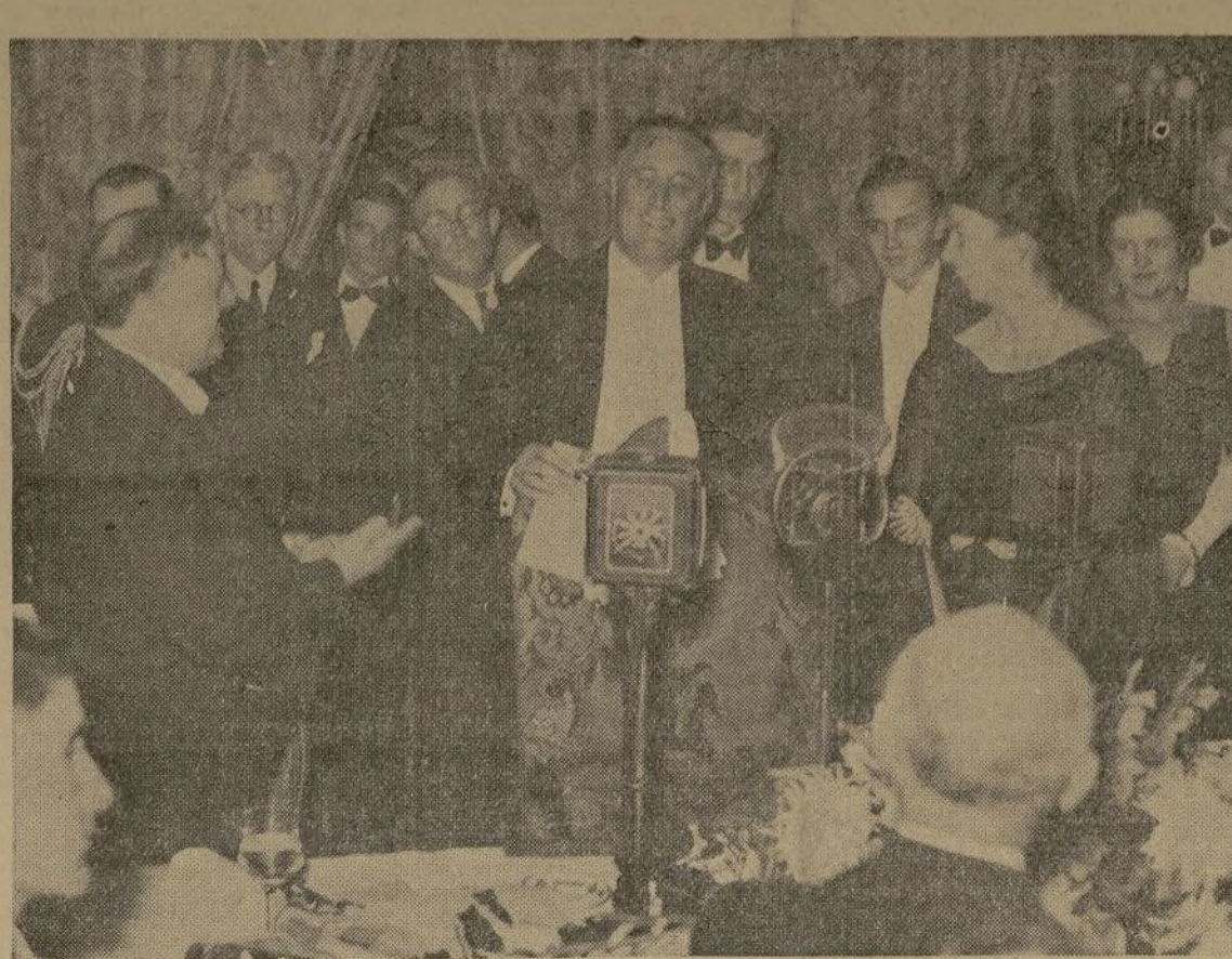
El presidente Roosevelt, durante el banquete celebrado en Washington para conmemorar el aniversario del nacimiento de Woodrow Wilson y en el que declaró que en adelante, la política de este país se opondrá inalterablemente a la intervención armada en sus relaciones con los países vecinos.