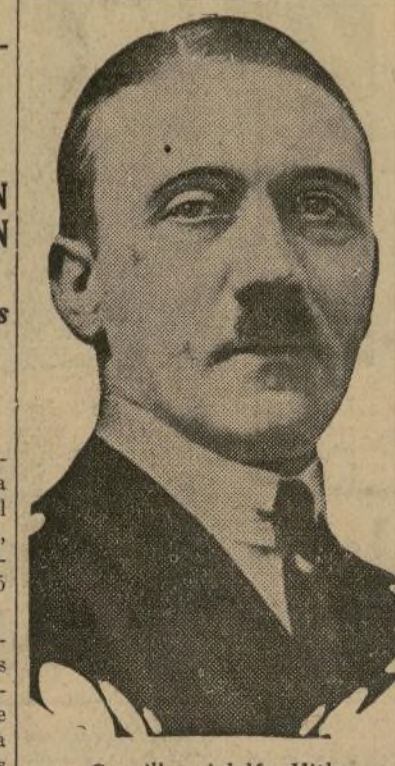
Canciller Adolfo Hitler