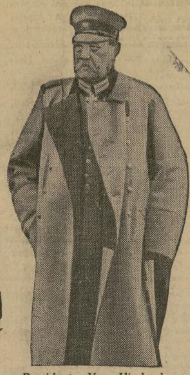
Presidente Von Hindenburg