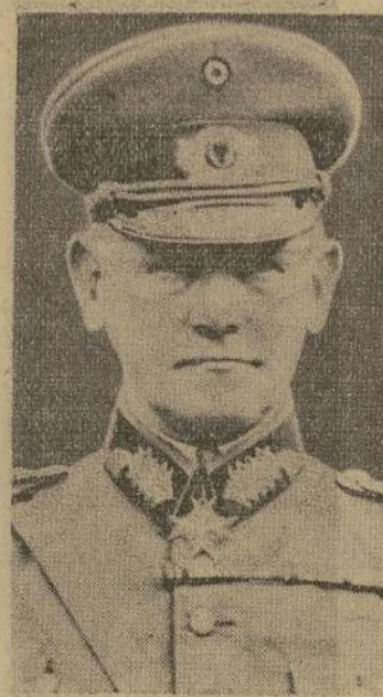
LIEUT. GEN. VON BLOMBERG