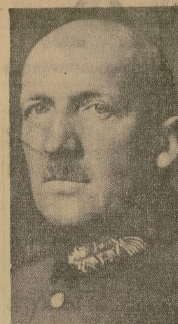
GEN. VON SCHLEICHER