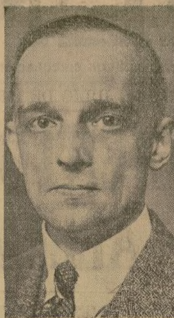
HERBERT VON BOSE