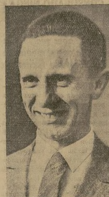
DR. JOSEPH GOEBBELS