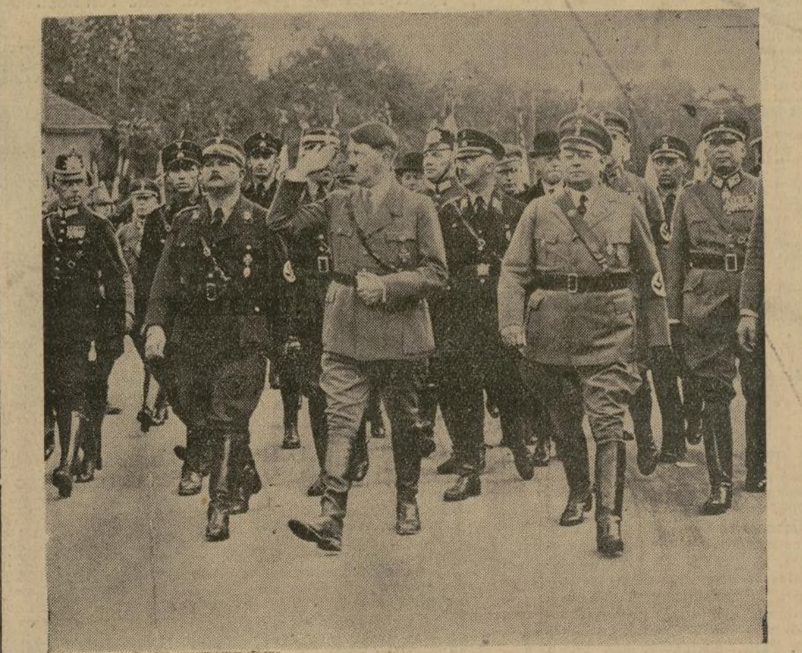
El canceller Hitler con el capitán Ernst Roehm (a la izquierda), jefe de las tropas de asalto y uno de los directores de la revolución que fué puesto contra un muro en Munich y fusilado, y el ministro Seldte, jefe de los "cascos de acero", revisando las tropas durante una parada militar celebrada en Hanover.

ANTES DE QUE SE DECLARARA LA SEGUNDA REVOLUCIÓN EN ALEMANIA