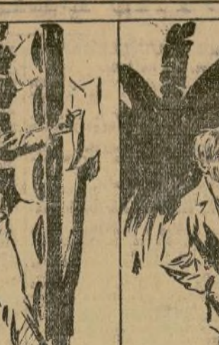
H. T. T. T.

Un marinero agarró al profesor por el cuello y gritó al oído: "¡Tena en voz alta, idiota!"