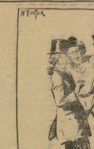
H. T. T. T.

Un marinero agarró al profesor por el cuello y gritó al oído: "¡Tena en voz alta, idiota!"