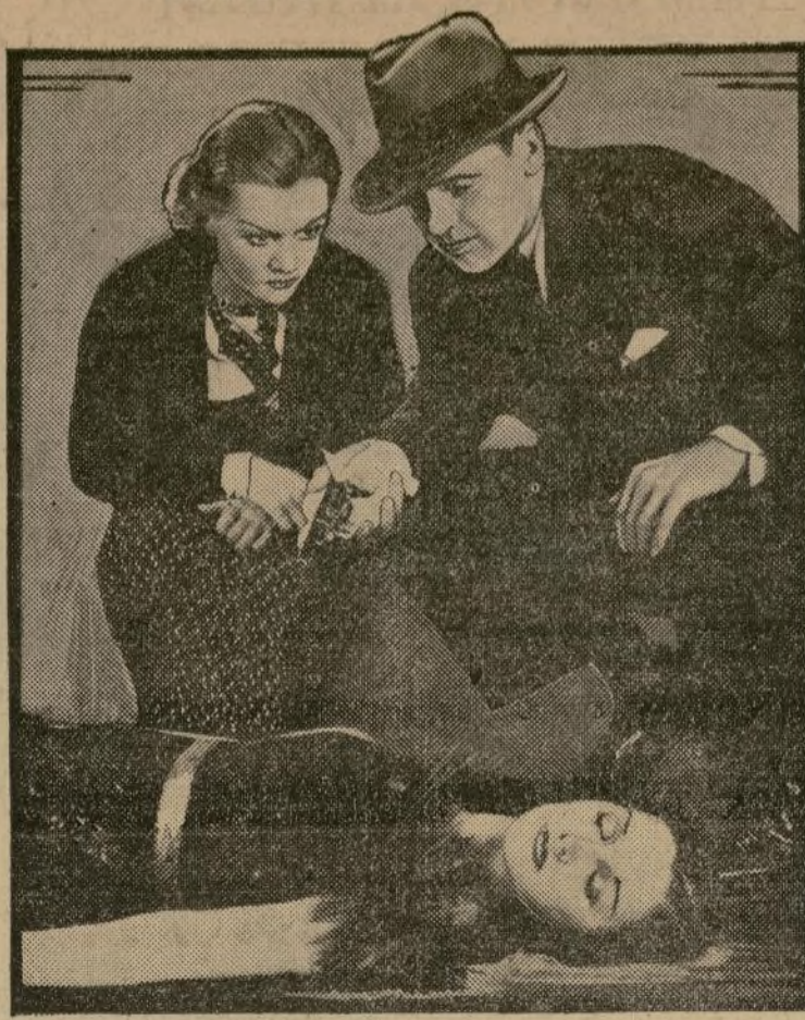
Gail Patrick, Shirley Grey y Ralph Bellamy en esta interesantísima cinta que de sábado a martes presentarán los teatros Regent y Hamilton.