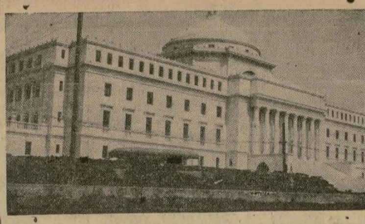
Ya próximo a entrar en San Juan, el presidente Roosevelt admiró la bella estructura del hogar donde se incuban las leyes para el gobierno de Puerto Rico.