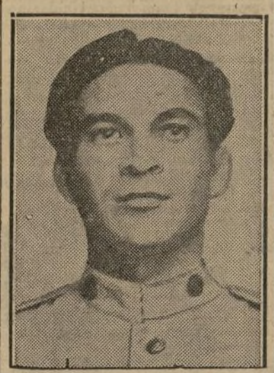
Coronel Fulgencio Batista

"Mi error", dijo, "consistió en no prever que un bandido se hallaba en libertad y que haría uso de mis cartas diez meses después de haberlas escrito."