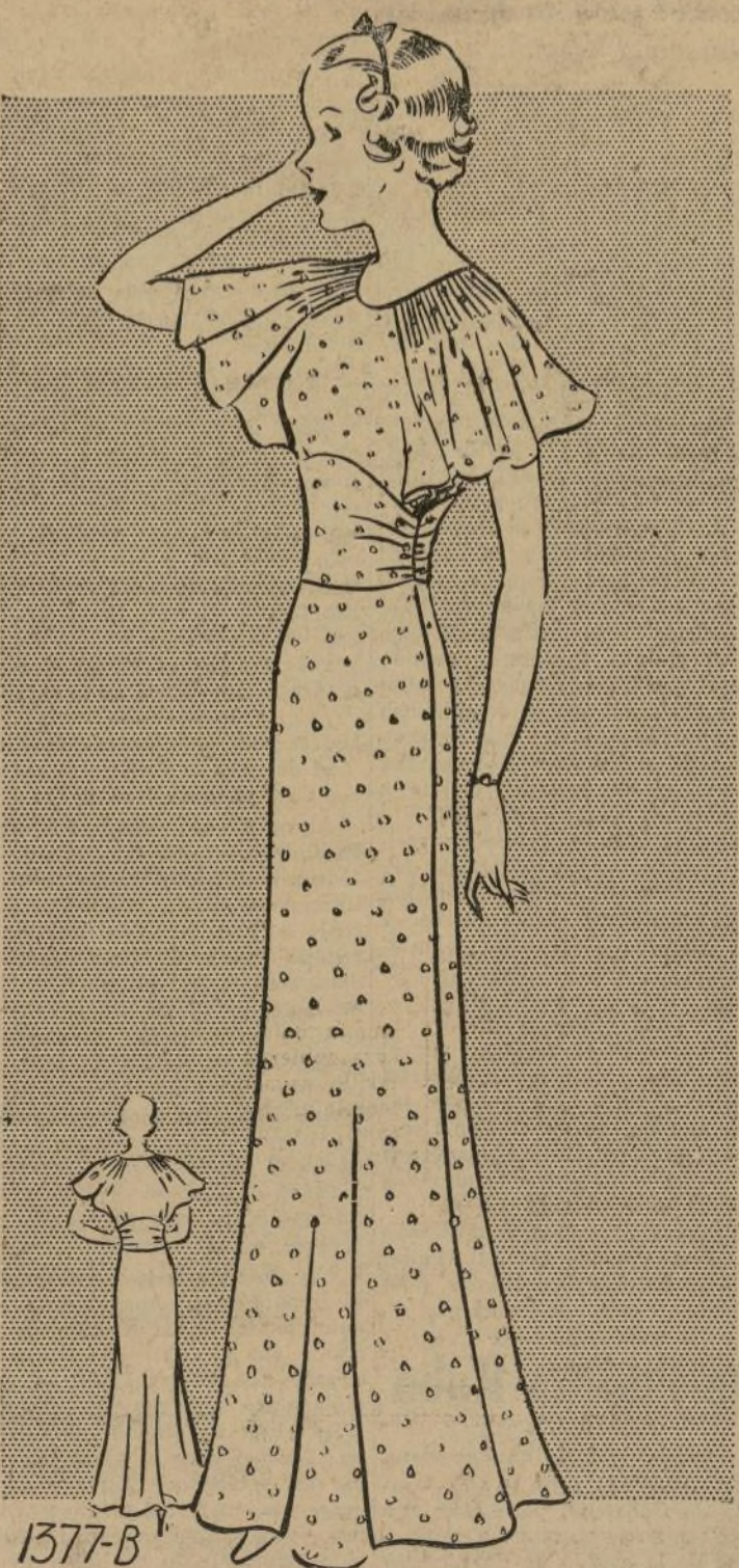
VESTIDO DE NOCHE PARA MUCHACHA JOVEN

1377-B. — La temporada de verano automáticamente trae una serie de invitaciones de gala a la dama que goza de popularidad y para asistir a ellas tiene que tener una bonita y variada selección de vestidos. El vestido de semi-etiqueta que ilustramos hoy es muy apropiado para asistir a estas elegantes invitaciones que dejan a un uso, pensando lo que va a usar. Las líneas de este modelo son muy atractivas, igual que el cuello que al mismo tiempo sirve de manga. Este vestido confeccionado en telas de verano transparentes, pues usarse toda la temporada del estío. Con este traje y un sombrero de ala ancha, adornado con flores, se hace una combinación muy linda, y puede usarse para asistir a una boda o también para la dama que actúa de madrina de boda. También puede usarse para atender a bailes de hoteles de verano y a bordo de vapores. El costo de este patrón es de 20c. Solamente en los tamaños especificados. Al ordenar cualquiera de estos patrones sírvase dar claramente la medida exacta que se desea.