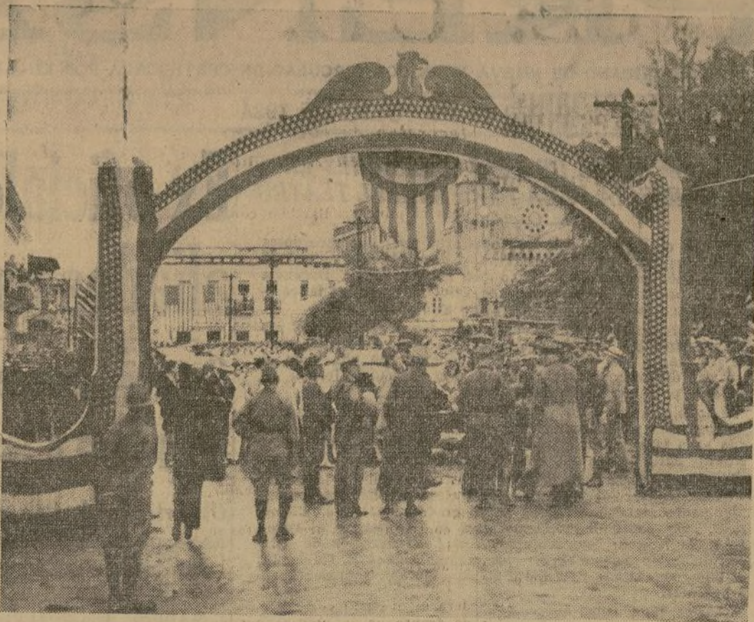
Arco construido en honor del presidente de los Estados Unidos en Caguas, una de las más bellas ciudades de Puerto Rico, a donde llegó el ejecutivo en su viaje a través de la isla.