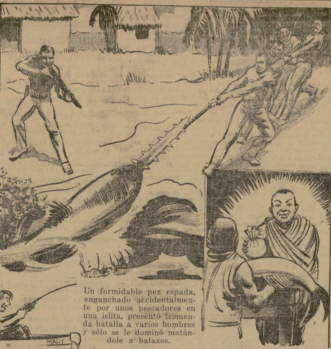
Un formidable pez espada, enganchado accidentalmente por unos pescadores en una isleta, presentó tremenda batalla a varios hombres y sólo se le dominó matándole a balazos.

Un pescador enganchó un pez por la cola.