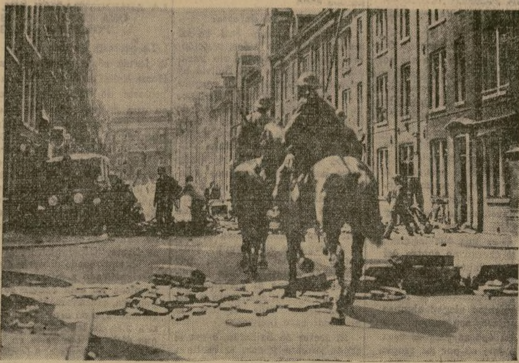
Tropas de caballería patrullando la sección Jordán de la capital holandesa en donde los amotinados construyeron barricadas, levantando el pavimento y usando los adoquines de proyectiles, en su lucha contra la policía y las fuerzas del ejército.

Paraguay parece a punto de romper la línea boliviana ya