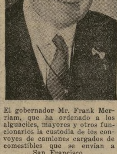
El gobernador Mr. Frank Merriam, que ha ordenado a los milicianos la custodia de los convoyes de camiones cargados de comestibles que se envían a San Francisco.

Gobernador de California Millares de milicianos, concentrados en la ciudad, instalan ametralladoras Cañones de montaña y tanques hacen irrupción en San Francisco.—Siguen llegando tropas a la ciudad en huelga.—Expectación intensa