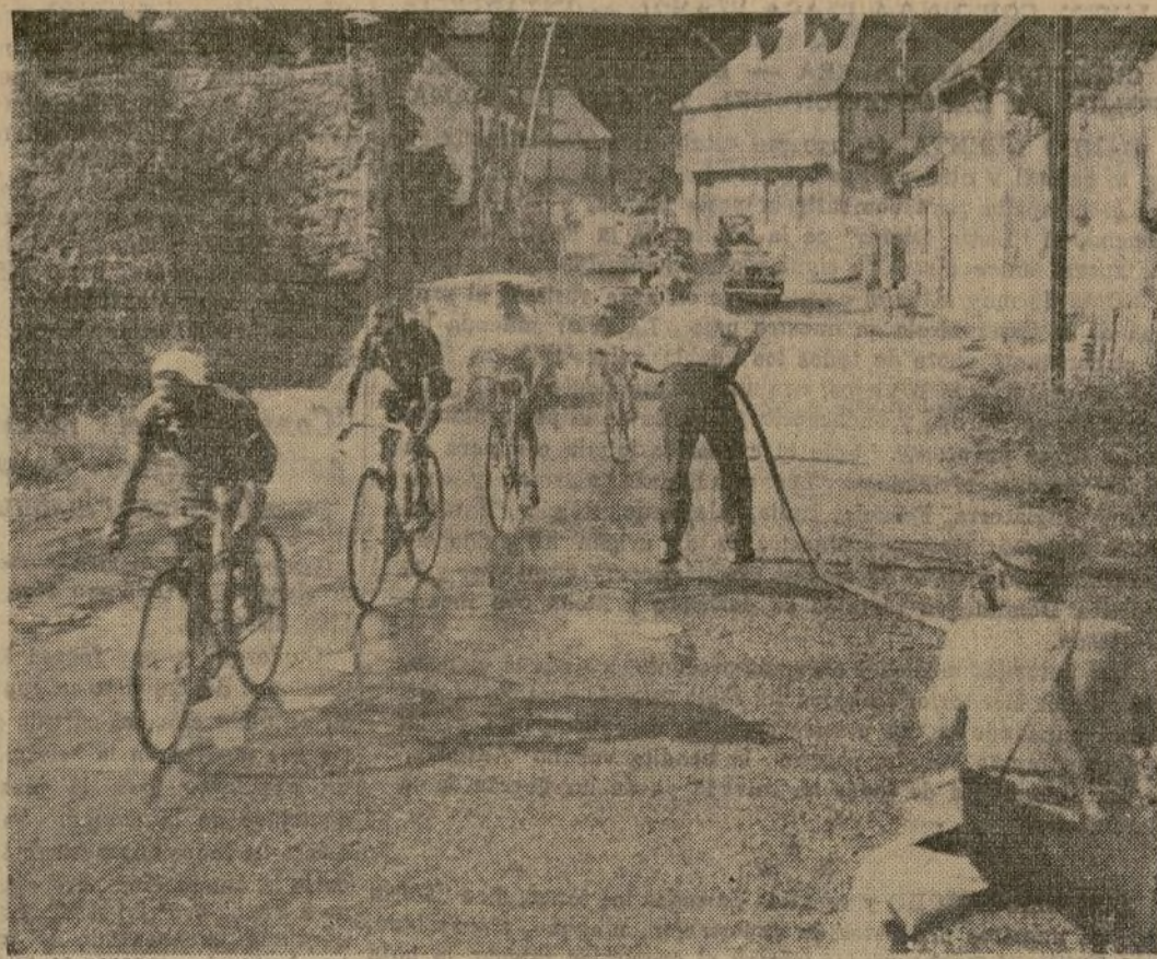
Los corredores que tomaron parte en una carrera de resistencia de más de cien millas en Francia, reciben una ducha al pasar por la calle principal de uno de los pueblos del recorrido.

REFRESCANDO A LOS CORREDORES DE BICICLETA FRANCESES