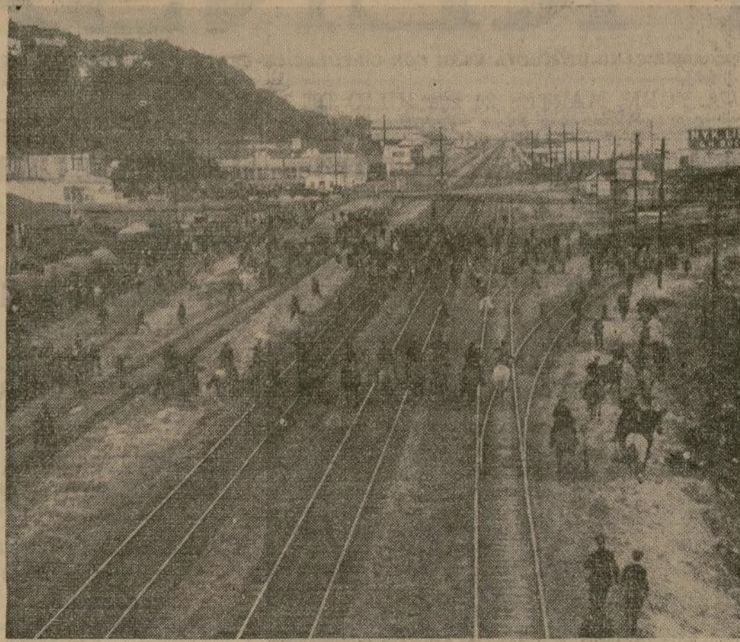
Los guardias de a caballo, avanzando por las vías del ferrocarril y haciendo retroceder a 2,000 huelguistas de los muelles, en una lucha en que casi todos los participantes, incluyendo al alcalde, sufrieron las consecuencias del gas lacrimógeno lanzado por la policía a éstos.