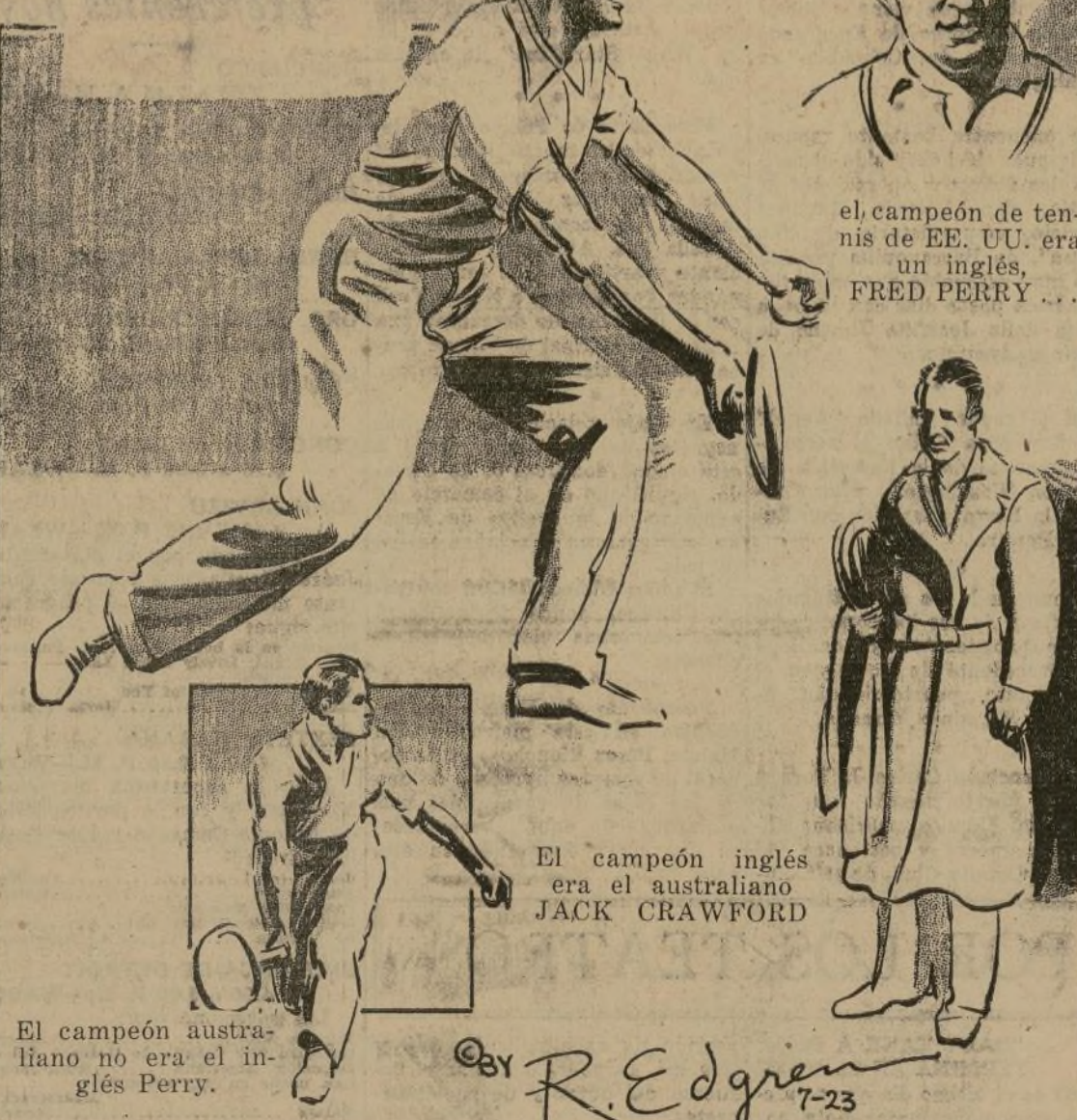
el campeón de tenis de EE. UU. era un inglés, FRED PERRY...