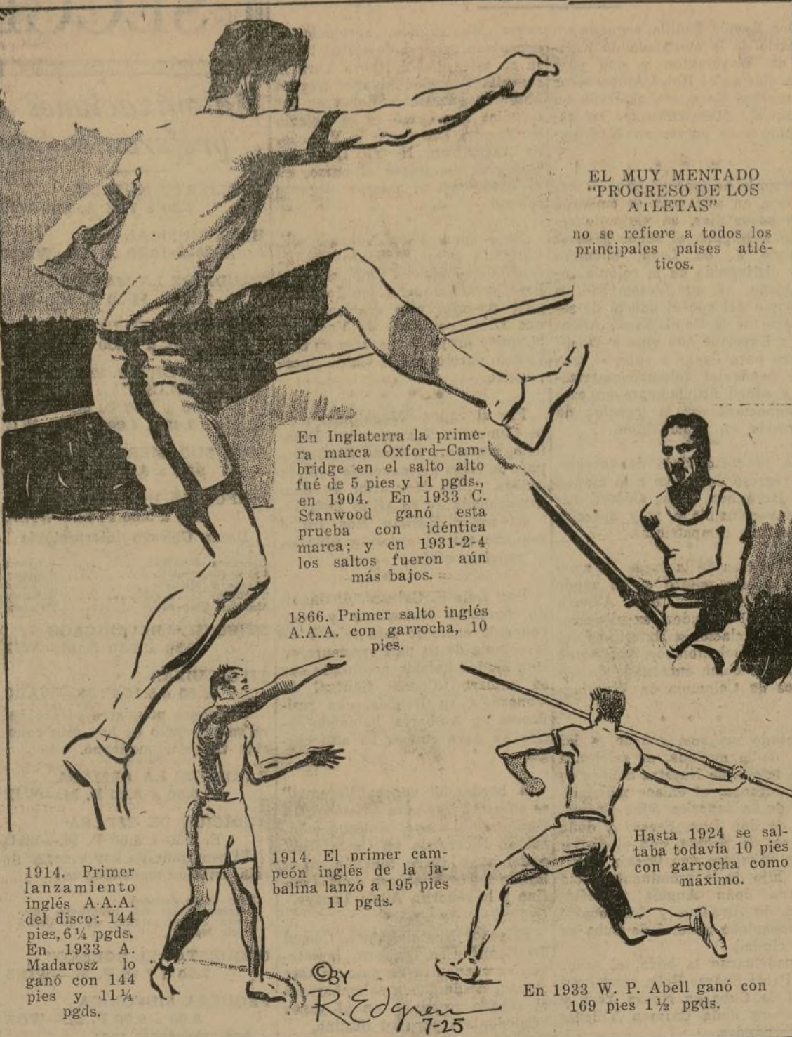
EL MUY MENTADO "PROGRESO DE LOS ALLETAS"

no se refiere a todos los principales países atléticos.