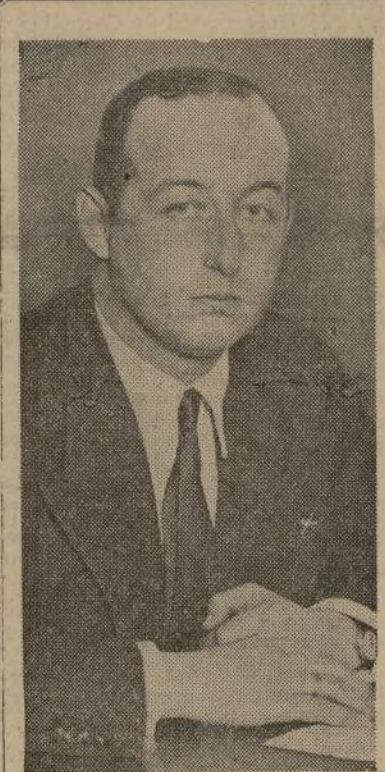
Príncipe Von Starhemberg

LONDRES, julio 26. (P).—Fuentes británicas autorizadas dicen hoy que los gobiernos de Inglaterra, Francia e Italia estaban convencidos de que no sería necesaria la actuación de las tres na-