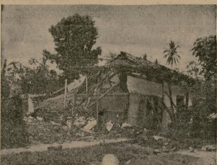
Restos de una casa de David, Panamá, en donde sufrieron heridas cuatro personas al derrumbarse el edificio con motivo de los dieciséis terremotos que ocurrieron en 24 horas en varios lugares de la América Central, causando enormes pérdidas.