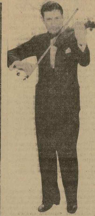
TANGUISTA DE VERDAD