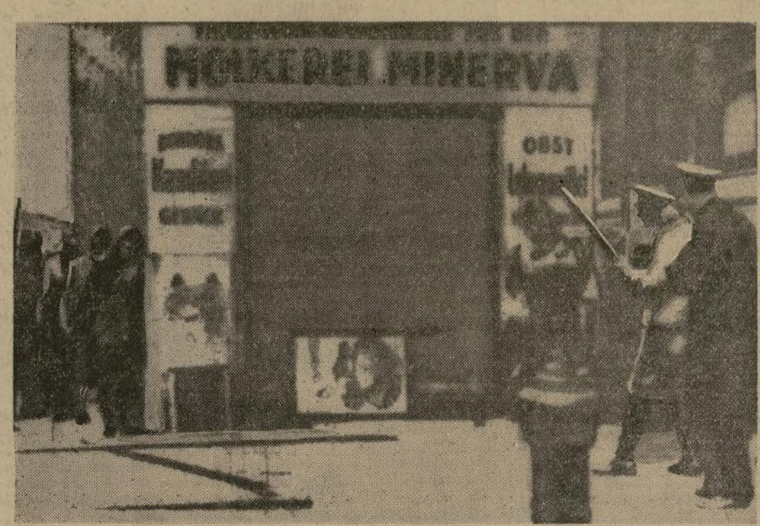
Llegada de la policía a la casa difusora de Ravag, para desalojar a los 8 nazis que detuvieron a 1,000 soldados leales por varias horas. Los nazis forzaron al empleado que anunciara la caída del gobierno de Dollfuss. Esta fotografía fue enviada de Viena a Londres por telégrafo y después por radio a Nueva York.

PRIMERA RADIOFOTOGRAFIA DE LA REVUELTA EN VIENA