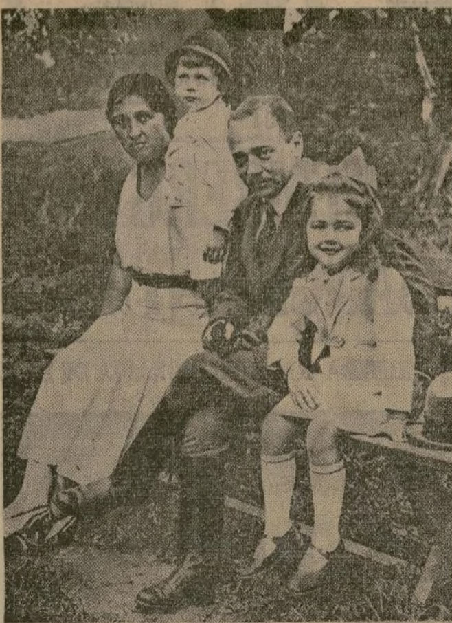
Engelbert Dollfuss que fué por dos años canciller de Austria. Enemigo de los "anschluss" o la unión con Alemania. Con su esposa e hijos en un parque de Viena.