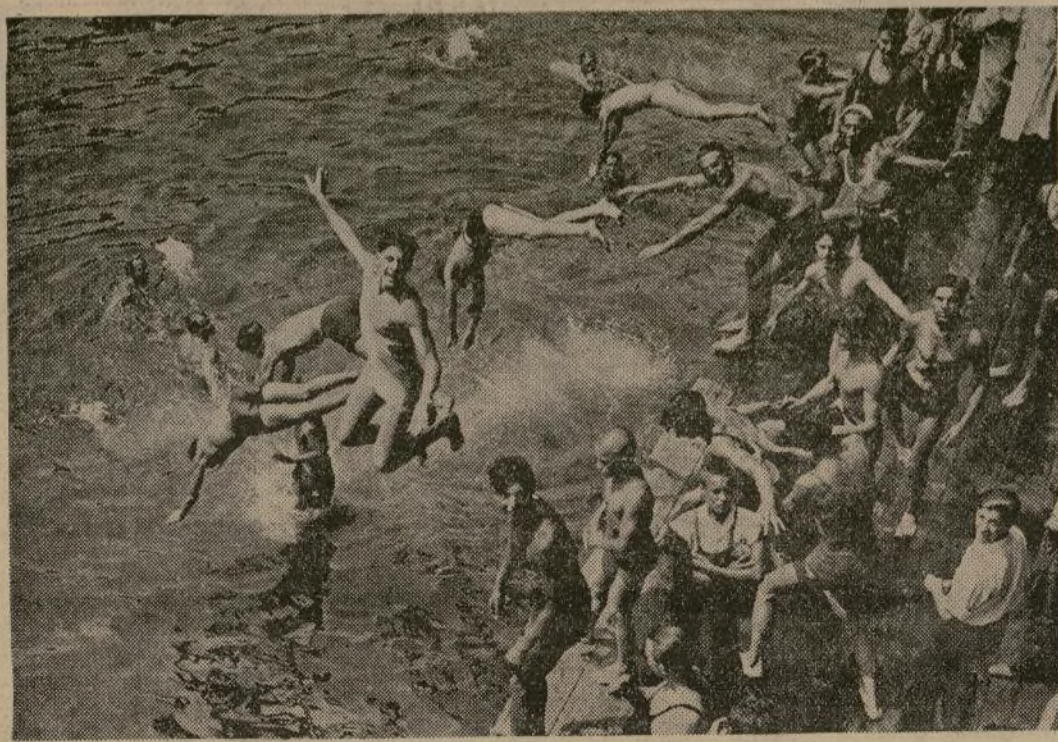
Cuando la temperatura se acercaba a los 100 grados y la mayor parte de la nación sufría el intenso calor, estos muchachos buscan alivio bañándose en las frescas aguas del río, desde un muelle del Río Este.