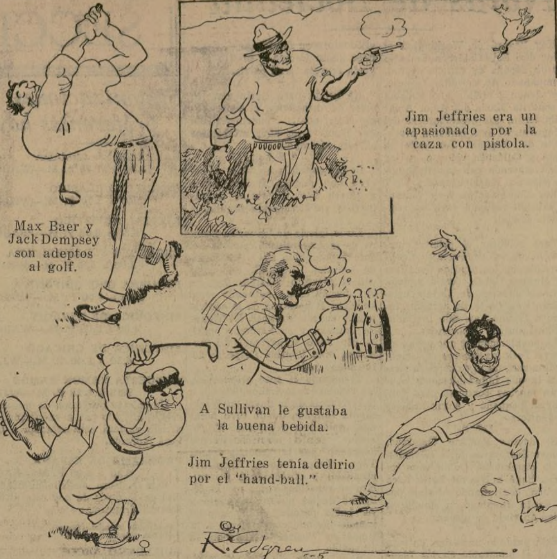
Max Baer y Jack Dempsey son adeptos al golf.