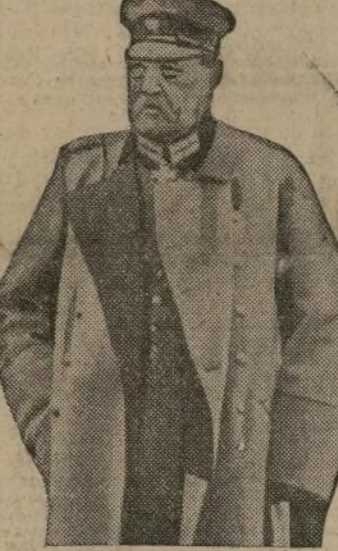
Presidente Von Hindenburg