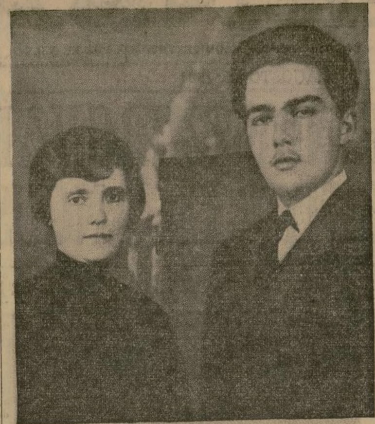
Otto, el hijo del último emperador Hapsburgo de la doble monarquía, y la ex-emperatriz Zita. Sus simpatizantes en Viena están planeando reinstaurarlos en el trono.