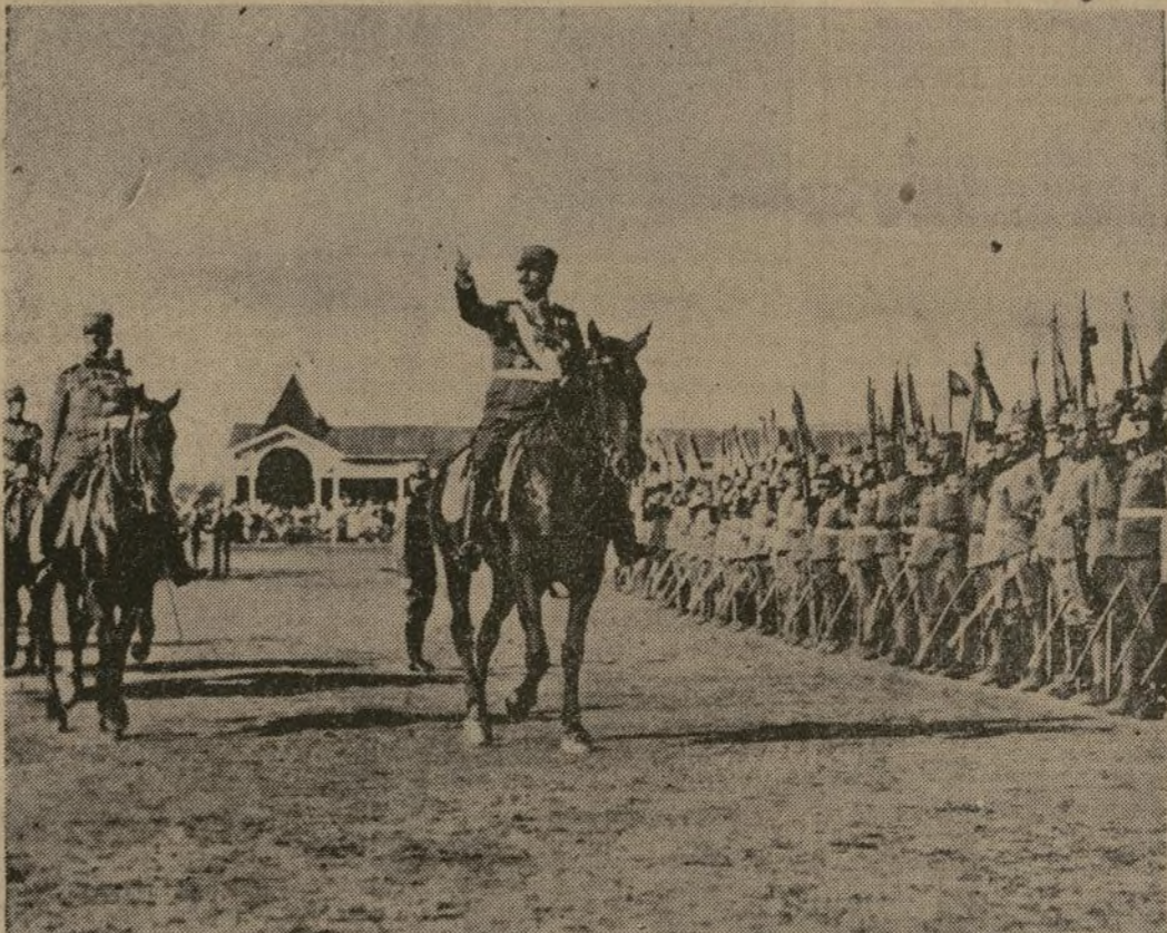
El rey Alejandro de Yugoslavia, inspeccionando sus tropas, unas semanas antes de prevenir a Italia por medio de la embajada en Berlín, la intervención en los sucesos austriacos. Agregó en su nota preventiva que "en caso de complicaciones especiales" estas últimas deben ser arregladas por la Liga de Naciones y no por las naciones que rodean a Austria.

YUGOSLAVIA PREVIENE A ITALIA POR LO DE AUSTRIA