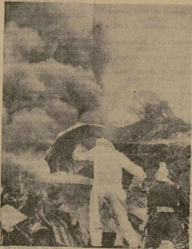
Con una sombrilla hecha de asbestos, un traje y una máscara hechos del mismo material con el objeto de poder acercarse al fuego, se puede ver a los hombres en una reciente prueba hecha en un campo de Londres.