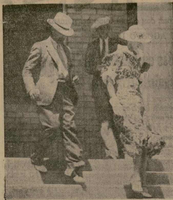
La Sra. Curtis B. Dall, única hija del presidente Roosevelt, obtuvo el juez Clark J. Gould el divorcio en 10 minutos. En la fotografía aparece saliendo de la Corte de Minden, Nevada, a 45 millas de Reno. Su hermano Elliott obtuvo un divorcio en la misma Corte el año pasado.