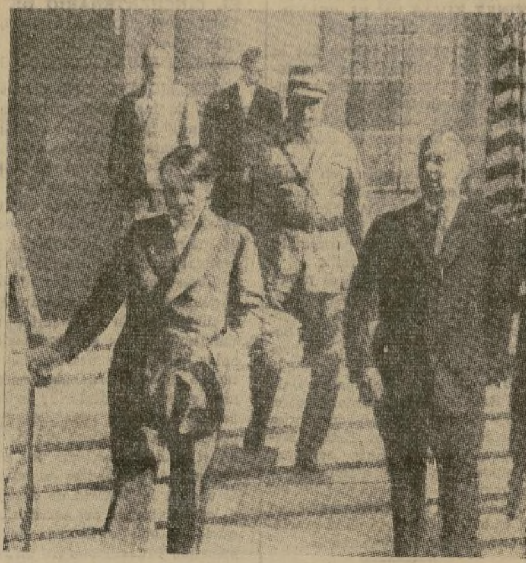
Cuando la mayor parte de los enemigos del canceller Hitler esperaban que éste, al hablar ante el Reichstag de la memoria de von Hindenburg, encendiera de indignación e inquietud al mundo pacifista con declaraciones preñadas de amenazas y de profecías de guerras, el Fuehrer causó a sus detractores toda una sorpresa limitándose a hablar de los pacíficos planes de su gobierno, de su amor a la paz y de la determinación de Alemania de “proceder sólo en el sentido defensivo” en lo tocante a cualquier posible acción de armas.