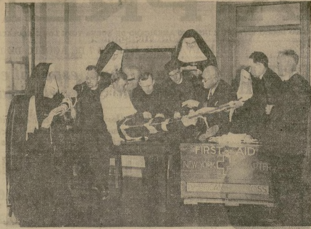
Las monjas y sacerdotes católicos que serán enviados como misioneros a Puerto Rico y a las secciones de los indios en el oeste de los Estados Unidos, pasando por las últimas pruebas de asistencia médica antes de recibir los certificados de competencia.