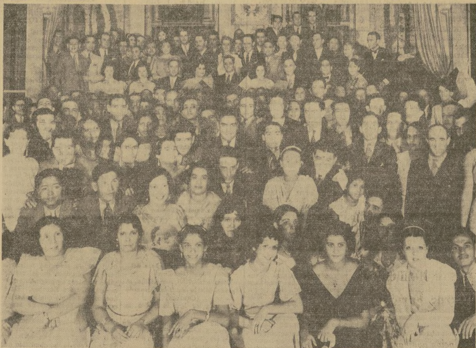
Presidido por el Cónsul General del Ecuador, don Sixto Durán Ballen, y patrocinada por el Ecuador Sport Club, se celebró el sábado el CXIV aniversario de la independencia del Ecuador, en el Harlem Palace de esta ciudad. El festival resultó espléndido acudiendo lo más prominente de la colonia ecuatoriana radicada en esta ciudad, y bastantes miembros de otras colonias hispanas. El discurso principal corrió a cargo del señor Durán, y el baile se prolongó hasta horas avanzadas de la noche.

LA COLONIA ECUATORIANA CELEBRÓ LA INDEPENDENCIA PATRIA