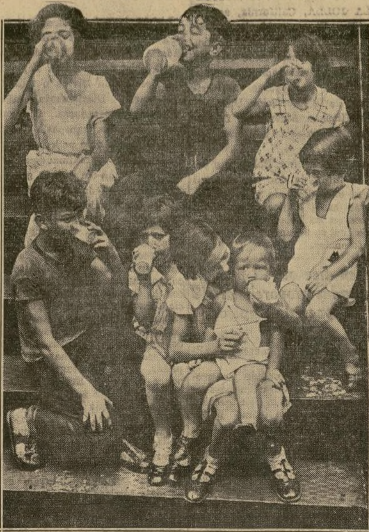
Las autoridades del estado de Nueva York están llevando a cabo una campaña para convencer a los padres de familia de la prudencia de dar toda la leche posible a los niños, no sólo como alimento inmejorable, sino también como medio eficaz de combatir muchos males.