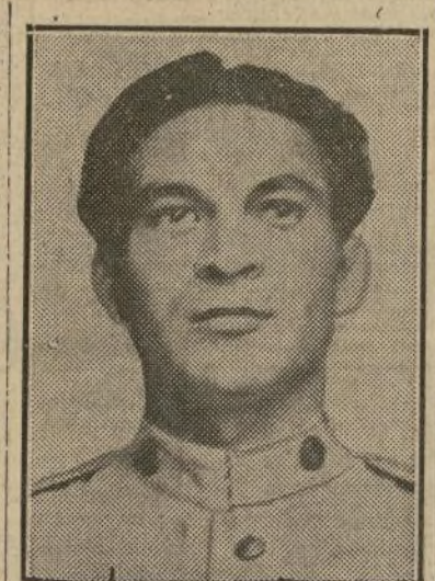
Coroneel Fulgencio Batista

ta "una dificultad" general en muchos estados.