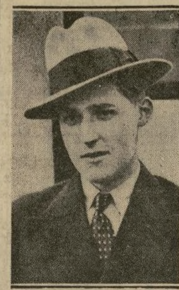
Don Gonzalo de Borbón

"¡Que echen a los curas!", piden las masonas en Méjico