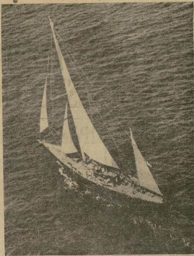
Hechos los reajustes necesarios después de la larga travesía desde Londres, incluso la instalación del enorme mástil, el “Endeavour”, balandro inglés relator por la copa “América”, se halla listo para las pruebas en aguas americanas antes de la gran regata.