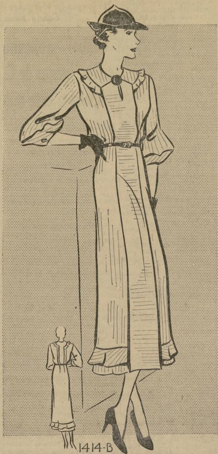
MODELO DE CALLE PARA OTOÑO

1414-B. — Nada más elegante ni más apropiado que el vestido que presentamos hoy para asistir a un almuerzo en los días primeros de Otoño. Está ejecutado en una tela de seda opaca, de tejido de listas.