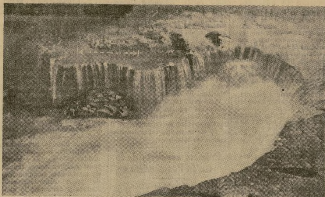
En esta fotografía aérea aparece la Catarata de la Herradura, en donde una enorme masa de roca caliza cayó desde 168 pies de altura, desmoronando una nueva formación. La línea de rayas indica el lugar del derrumbe.

10,000 TONELADAS DE ROCA SE DERRUMBAN EN EL NIÁGARA