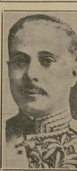
Gral. Trujillo, presidente de la República Dominicana