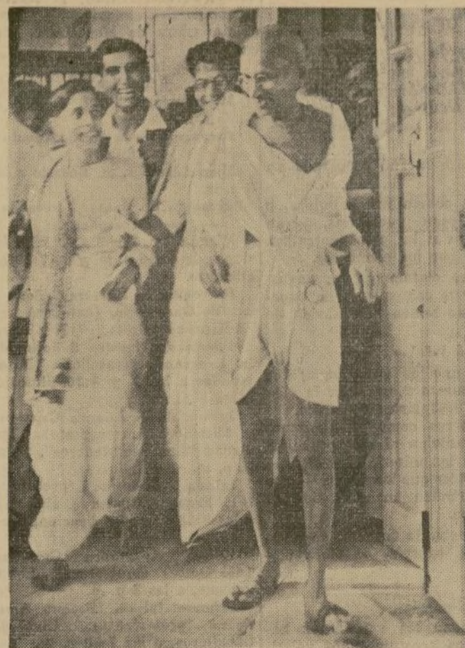
El famoso caudillo nacionalista indio, diciéndole a los informadores que acudirían a visitarle a Karachi, que la tercera parte de los ideales por que lucha ha sido realizada. Hace poco terminó otro ayuno de siete días.