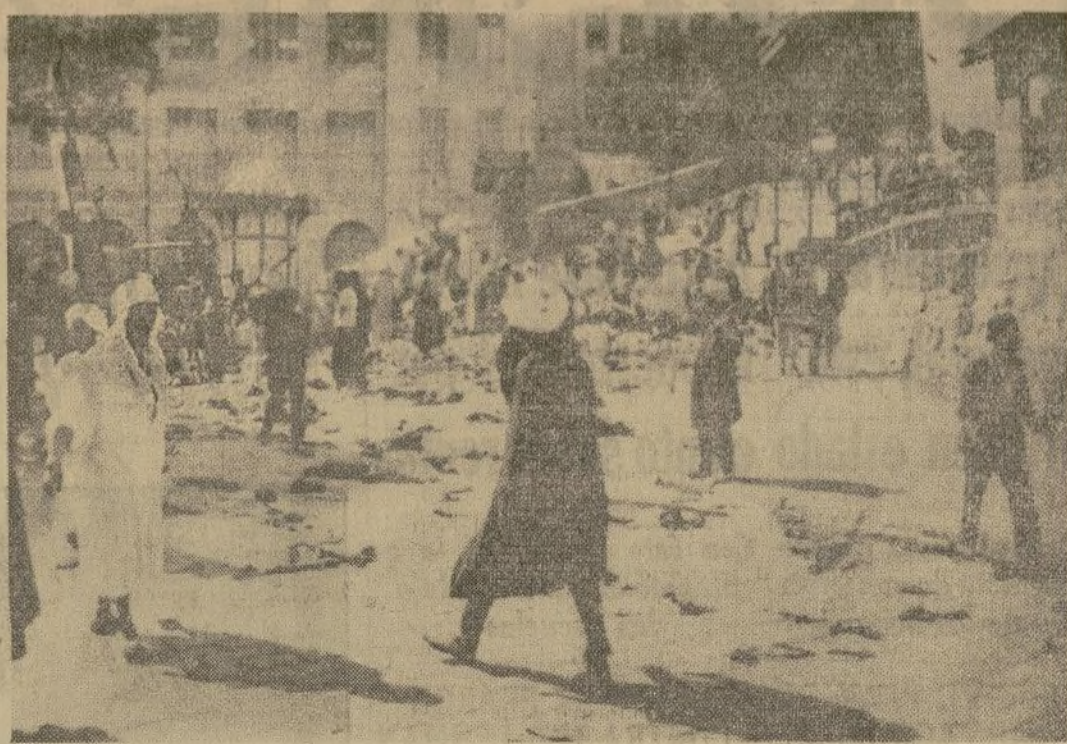
Calle de Constantina, Argelia, después de que las tropas francesas pusieron fin a los motines ocurridos entre los dos grupos y en el que se saquearon e incendiaron muchos establecimientos judíos, sucumbiendo 30 personas de muerte violenta y resultando heridas cien.