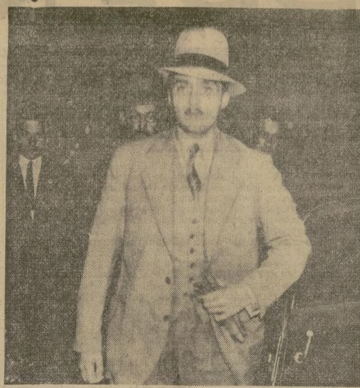
El archiduque Otto, hijo de la emperatriz Zita, por cuya restauración al trono trabajan los realistas en Austria, pasa por Copenhague durante una reciente visita a los países escandinavos.