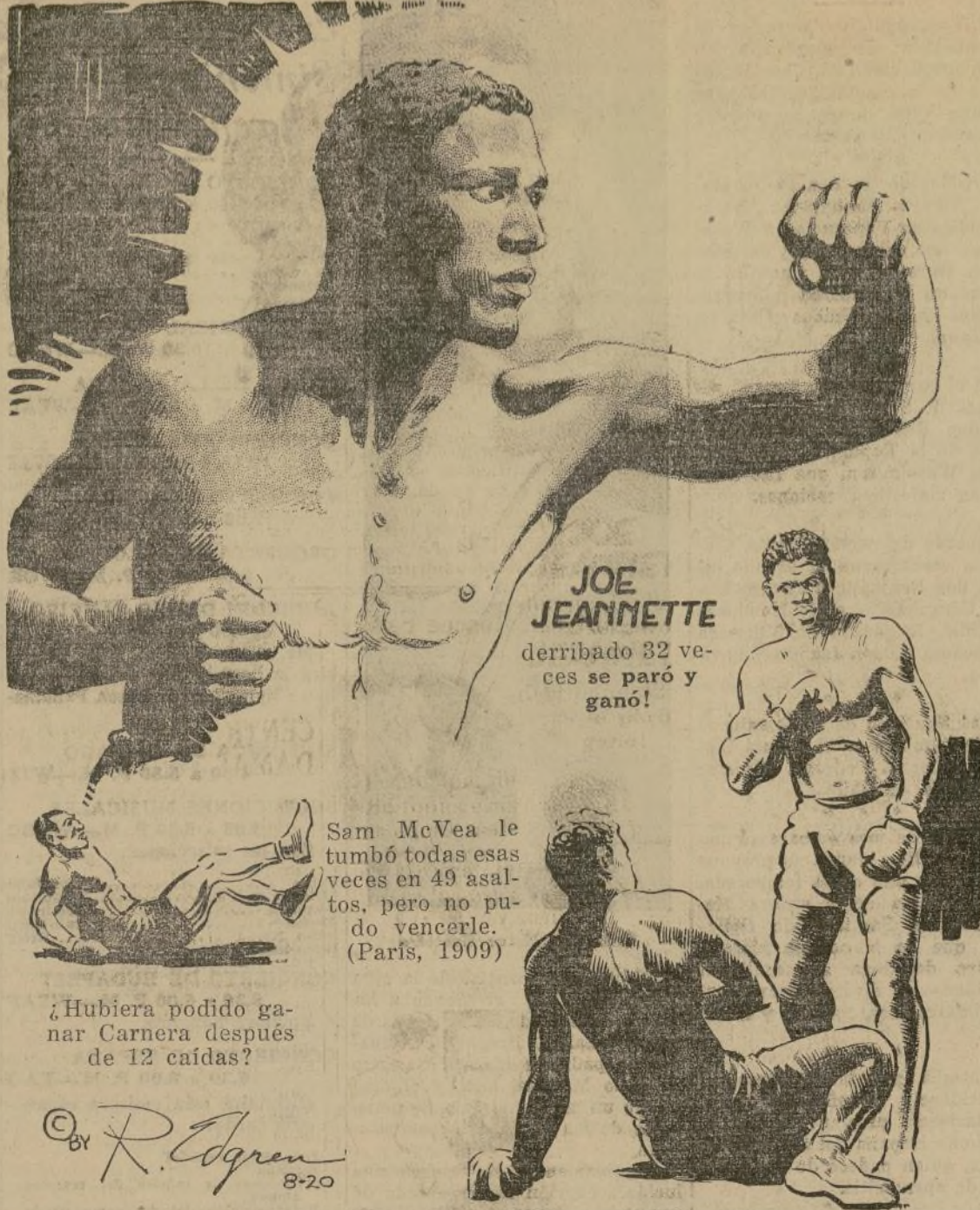
JOE JEANNETTE derribado 32 veces se paró y ganó!