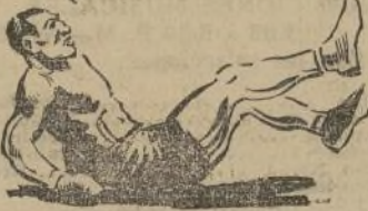
Sam McVea le tumbó todas esas veces en 49 asaltos, pero no pudo vencerle. (Paris, 1909)

¿Hubiera podido ganar Carnera después de 12 caídas?