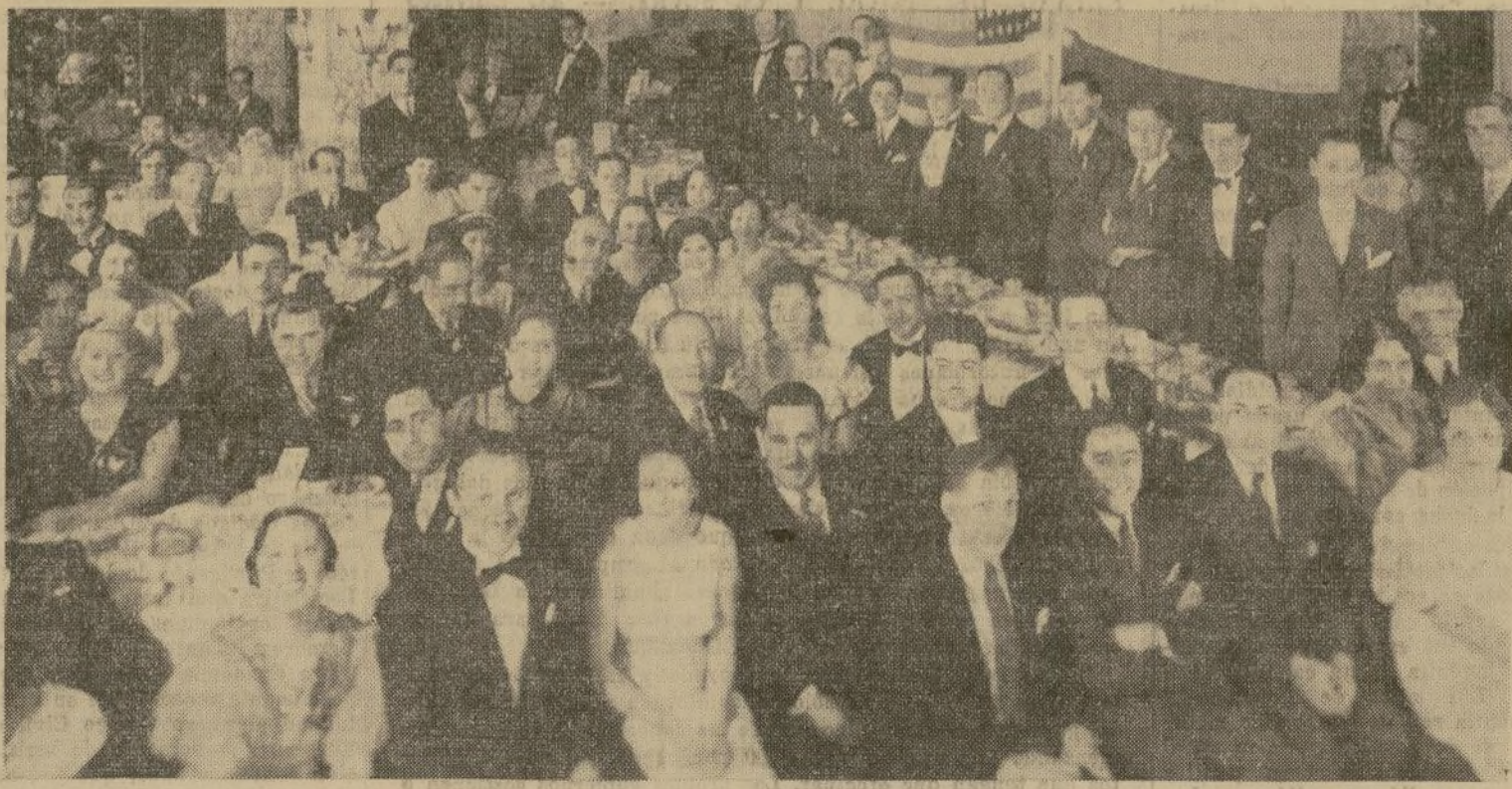
Parte de la lucida concurrencia que, para celebrar la histórica Batalla de Boyacá, se congregó el sábado en la noche, en el salón oceánico del Hotel Paramount. La velada consistió de banquete-baile y estaba patrocinada por el Club Unión Colombiana, de ideología patriótica-nacionalista, cuyos directores recibieron merecidas felicitaciones por la brillantez del acto.